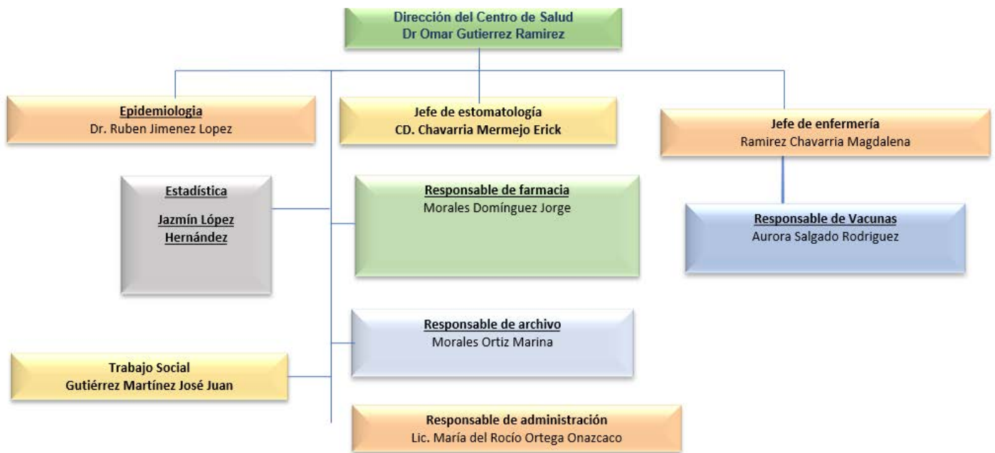
Organigrama 1: El Centro de Salud TII Ampliación Selene