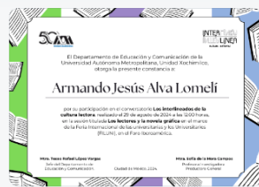
8 - S1