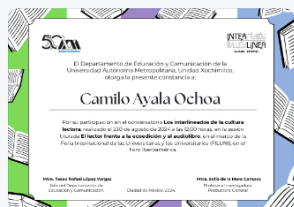
12 - S2