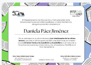
11 - S2