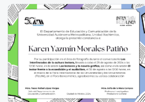
15 - foto