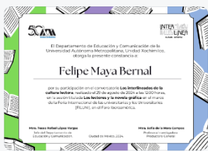
6 - S1