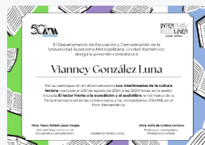
13 - S2