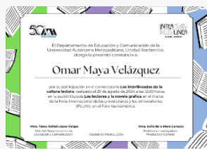
7 - S1