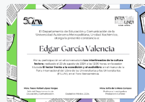
14 - S2