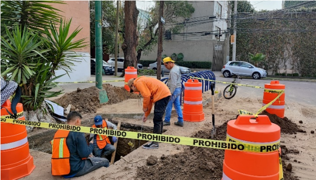
1.1 Construcción de pozos de absorción