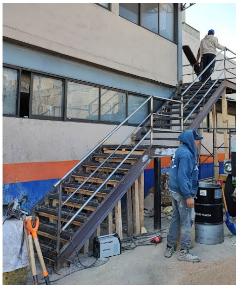
1.4 Construcción de escalera de servicio para edificio público de la alcaldía.