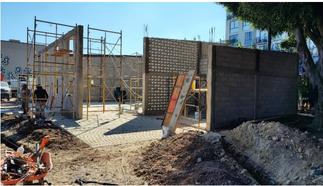
1.2 Construcción de bodega para infraestructura de alumbrado.