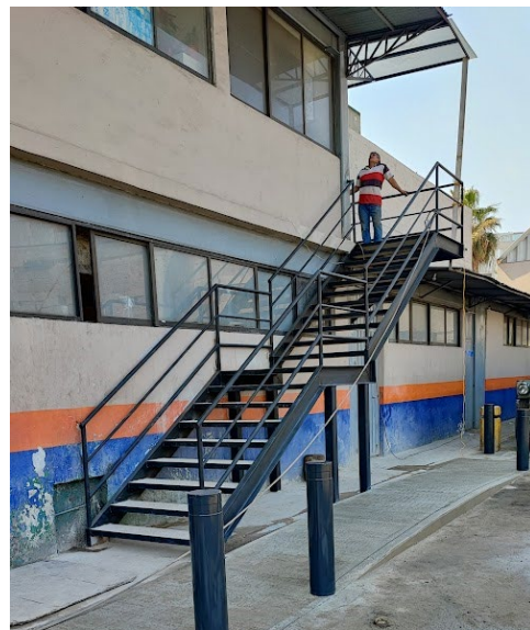
1.5 Construcción terminada de escalera de servicio para edificio público de la alcaldía.