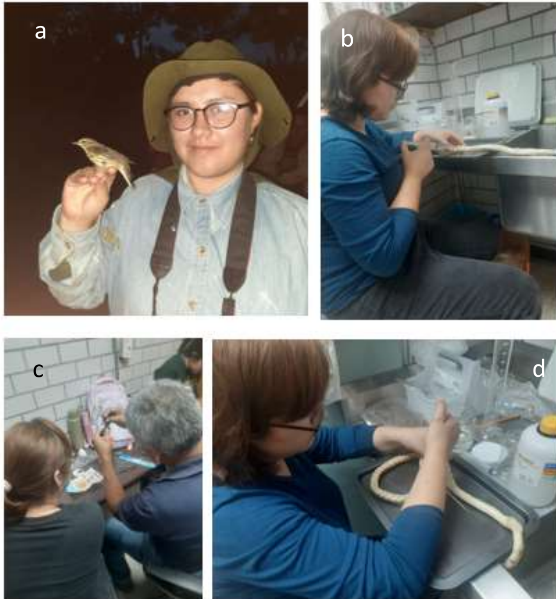
Figura 2. a) colecta de avifauna en el municipio de Zaachila, Oaxaca. b) y d) Preparacion de ejemplar Pituophis deppei para la colección de anfibios y reptiles de UAM-I c) preparacion de murcielago para la colección de mamíferos de la UAM-I