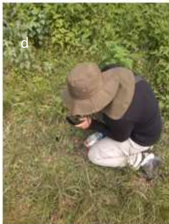
Figura 3. a) análisis bajo microscopio de excretas de cacomixtle norteño. b) excretas de cacomixtle norteño recolectadas en la sierra de santa Catarina, Iztapalapa c) manipulación de herpetofauna d) toma de fotografías de fauna en el área natural protegida lago de Texcoco.