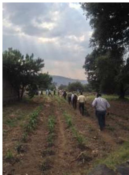
Imagen 1 y 2 Participación en recorridos Santa Cecilia Tepetlapa, Xochimilco 2016.