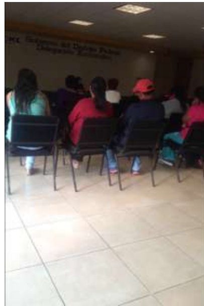
Imágenes 6 y 7 Asistencia a foros de trabajo para la actualización del programa delegación de desarrollo urbano delegación Xochimilco.