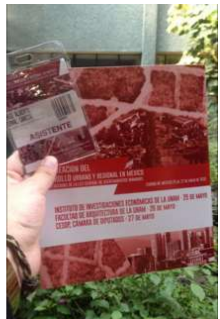
Imágenes 8, 9 y 10 Asistencia al foro "Planeación del desarrollo urbano y regional e México"