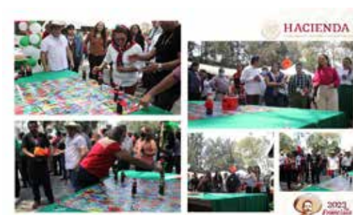
Fiesta Mexicana - Serpientes y escarabajos