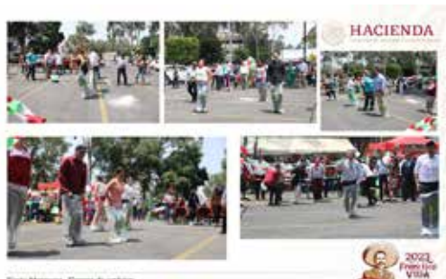
Fiesta Mexicana - Carrera de caballos