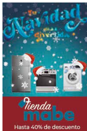
Muestras de algunos botones realizados para el apartado de descuentos