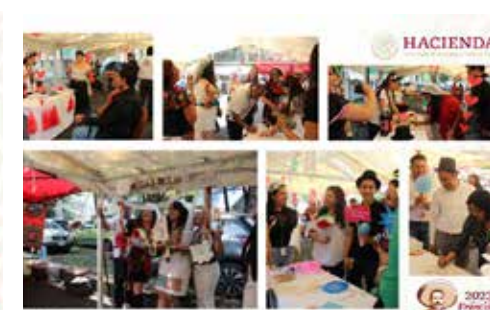
Fiesta Mexicana - Ringo's Café