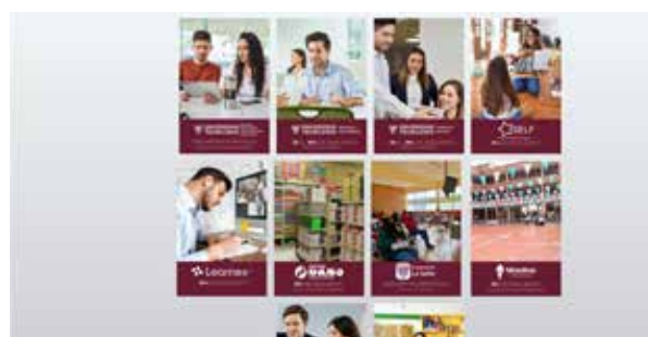
Interfaz de página web con material que realicé