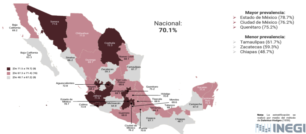
Ilustración 3 Porcentaje de violencia en México