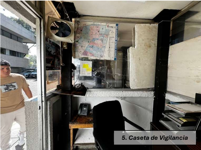
5. Caseta de Vigilancia