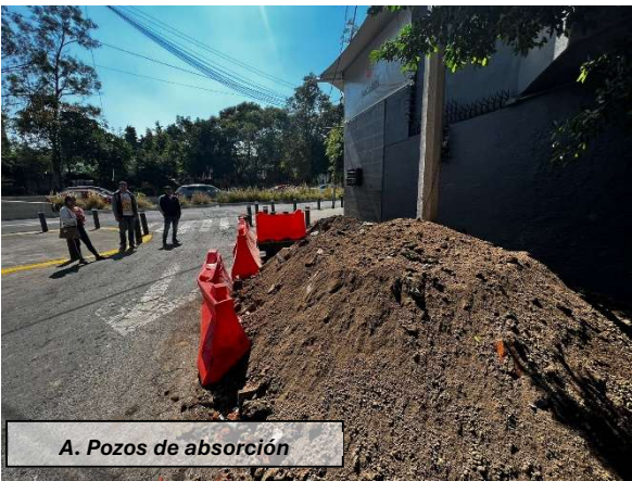
A. Pozos de absorción