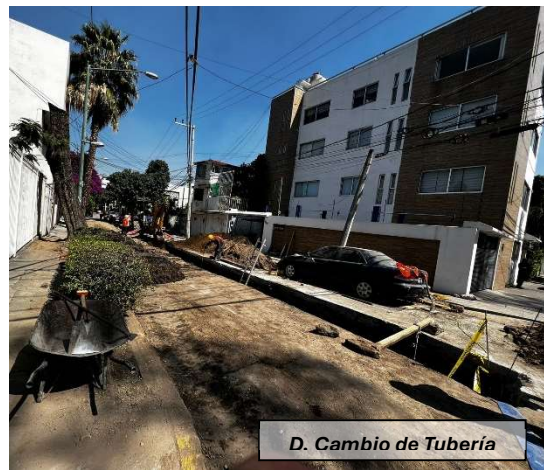
D. Cambio de Tubería