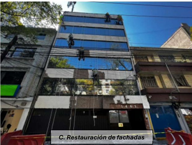
C. Restauración de fachadas