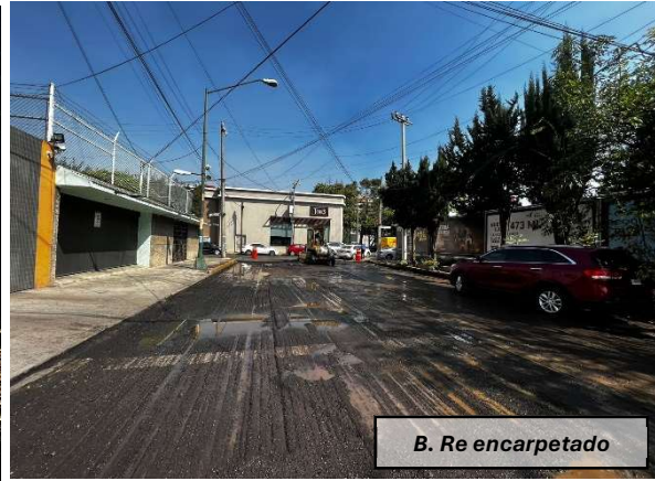
B. Re encarpetao