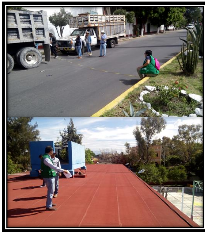
Ilustración 4 Revisión de trabajos de encarpetao asfáltico e impermeabilización en escuelas públicas.

Mi aprendizaje: pensando en cuestiones fundamentales, siempre hubo un buen trabajo en equipo e integración tanto de mi parte como de los integrantes que laboran en esta área, continúe aprendiendo de actividades tanto administrativas y de campo. Apoyado en levantamientos en los sitios para la corroboración de medidas, que ayudaban a comparar datos dentro de los generadores.