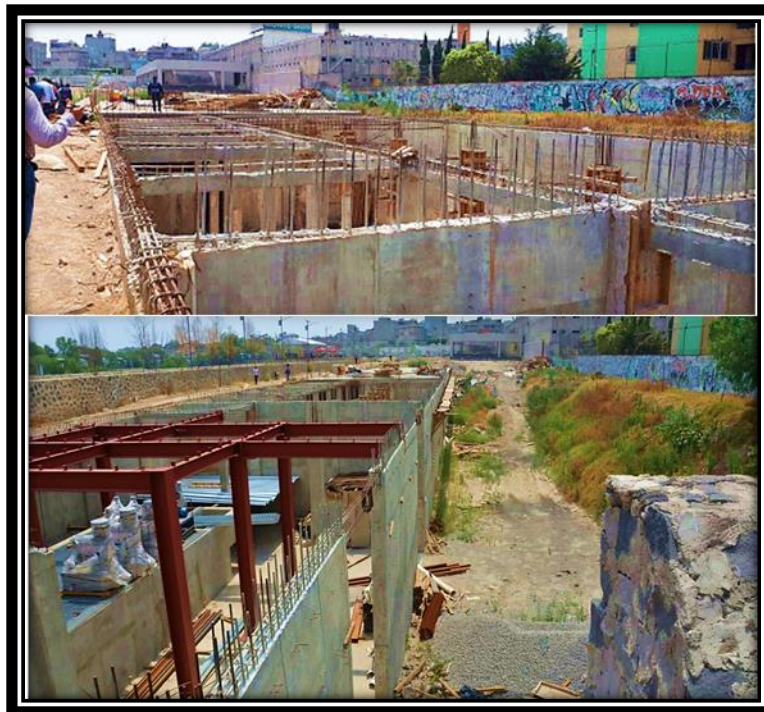
Ilustración 2 "La Quebradora" Parque Hídrico

Mi aprendizaje: en esta ocasión me sentí mucho mejor debido a que existió mayor participación una mejor interacción con el personal, lo cual me permite desenvolverme mejor en cualquier ambiente laboral, por otro lado, los reconocimientos me dieron esa oportunidad de observar más de cerca la obra pública y el uso correcto tanto de equipo como de materiales 2 . En cuestión a las sabanas de finiquito se tiene que ser muy minucioso y cuidadoso ya que cualquier error representa un gran costo e inversión, lo cual reflejaría una pérdida en obra que pudo no haber sido realizada. Aportando ayuda en las revisiones y demostrando profesionalismo en el desempeño de mis actividades.