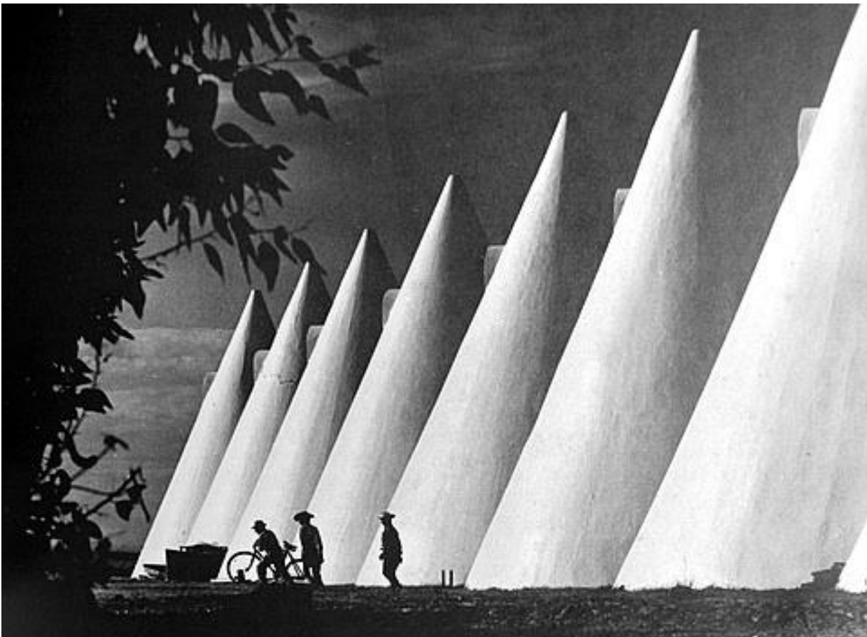
Imagen 8. Benjamín Arredondo. La increíble y triste historia de los silos de CONASUPO. México, http://vamonosalbable.blogspot.com/2012/09/la-increible-y-triste-historia-de-los.html . Fecha de consulta 18 de mayo de 2022.

Ya por último quiero destacar que los precios de los productos que se consideran básicos si aumentaron con relación a la desaparición de CONASUPO, puesto que una de las funciones era la de brindar alimentación de calidad a precios preferenciales y al desaparecer la empresa paraestatal se sustituyó por programas que ya no cumplían con ese objetivo.