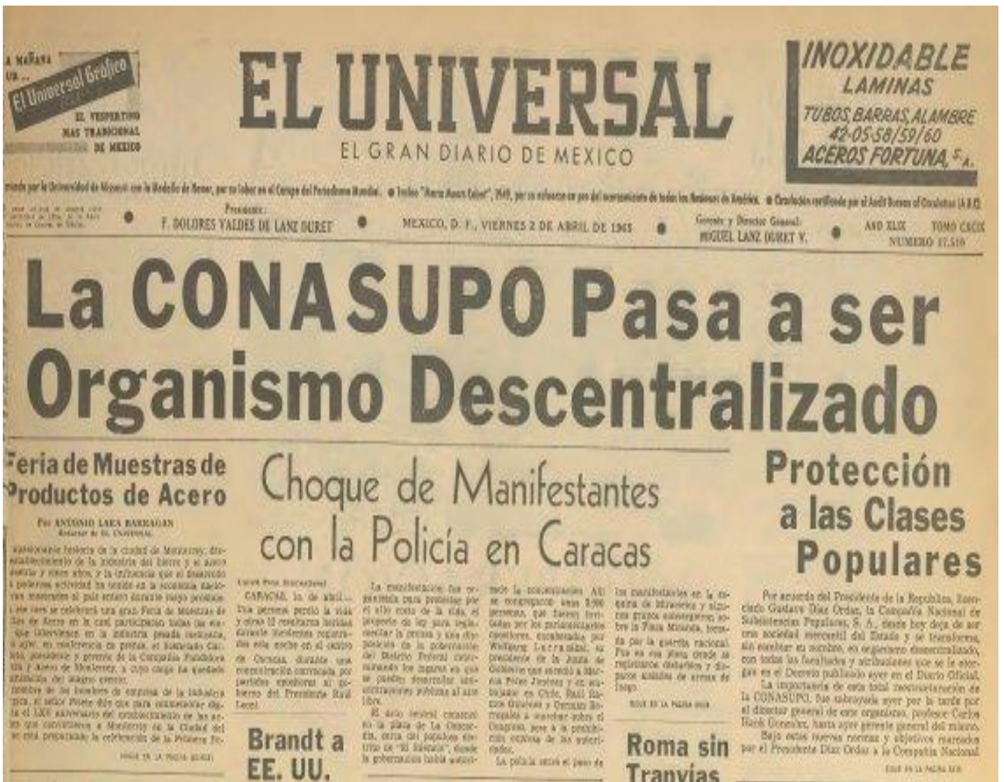
Imagen 1: Aída Castro Sánchez, “La Conasupo era la tienda del pueblo”, El Universal. 24 de julio de 2020. Archivo y Hemeroteca de El Universal

Con esta medida se pretendía que se les otorgara una protección a los ingresos de las personas ya que trataba que los precios en los productos básicos fueran más razonables, así también se buscaba un beneficio para los campesinos que se dedicaban al cultivo, pues se pretendía que los productos se pagaran a un precio justo: “En julio de 1961 la Compañía Nacional de Subsistencias Populares (CONASUPO) puso en operación 6 tiendas móviles