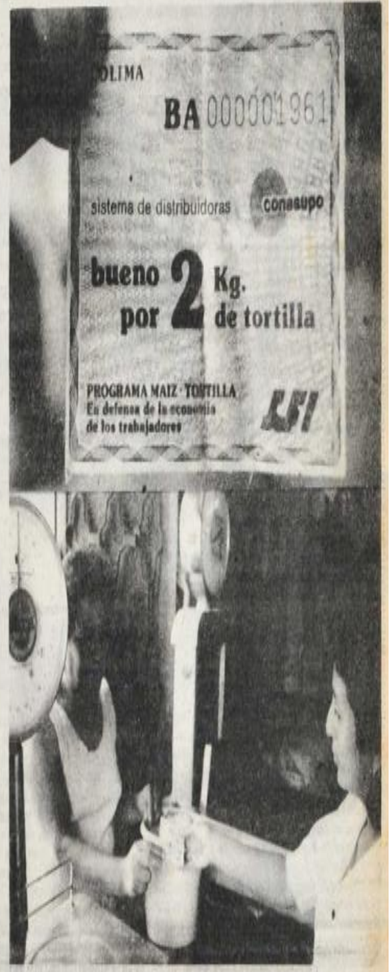
Imagen 6: Diario de Colima.