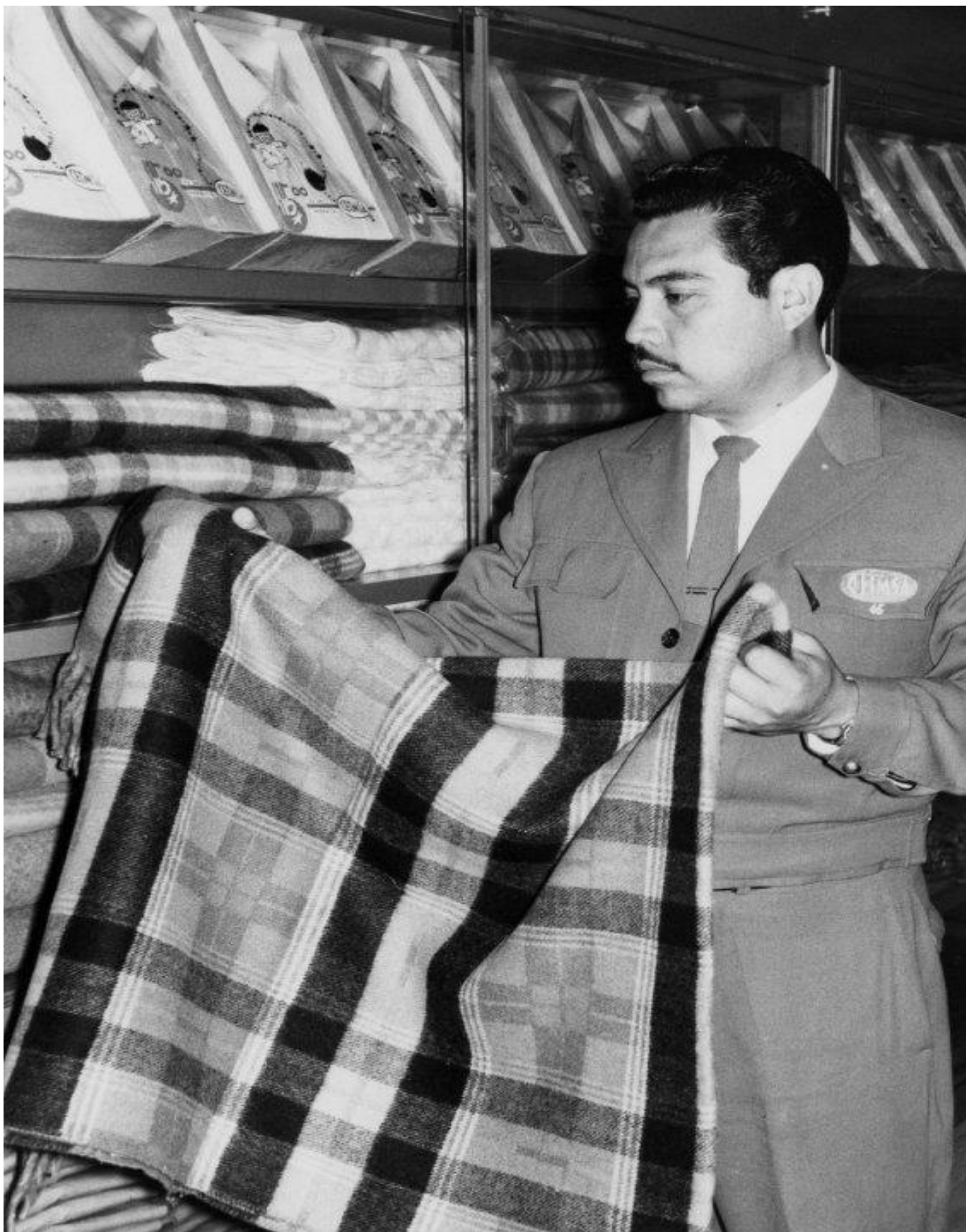
Imagen 4: Aída Castro Sánchez, “La Conasupo era la tienda del pueblo”, El Universal. 24 de julio de 2020. Archivo y Hemeroteca de El Universal