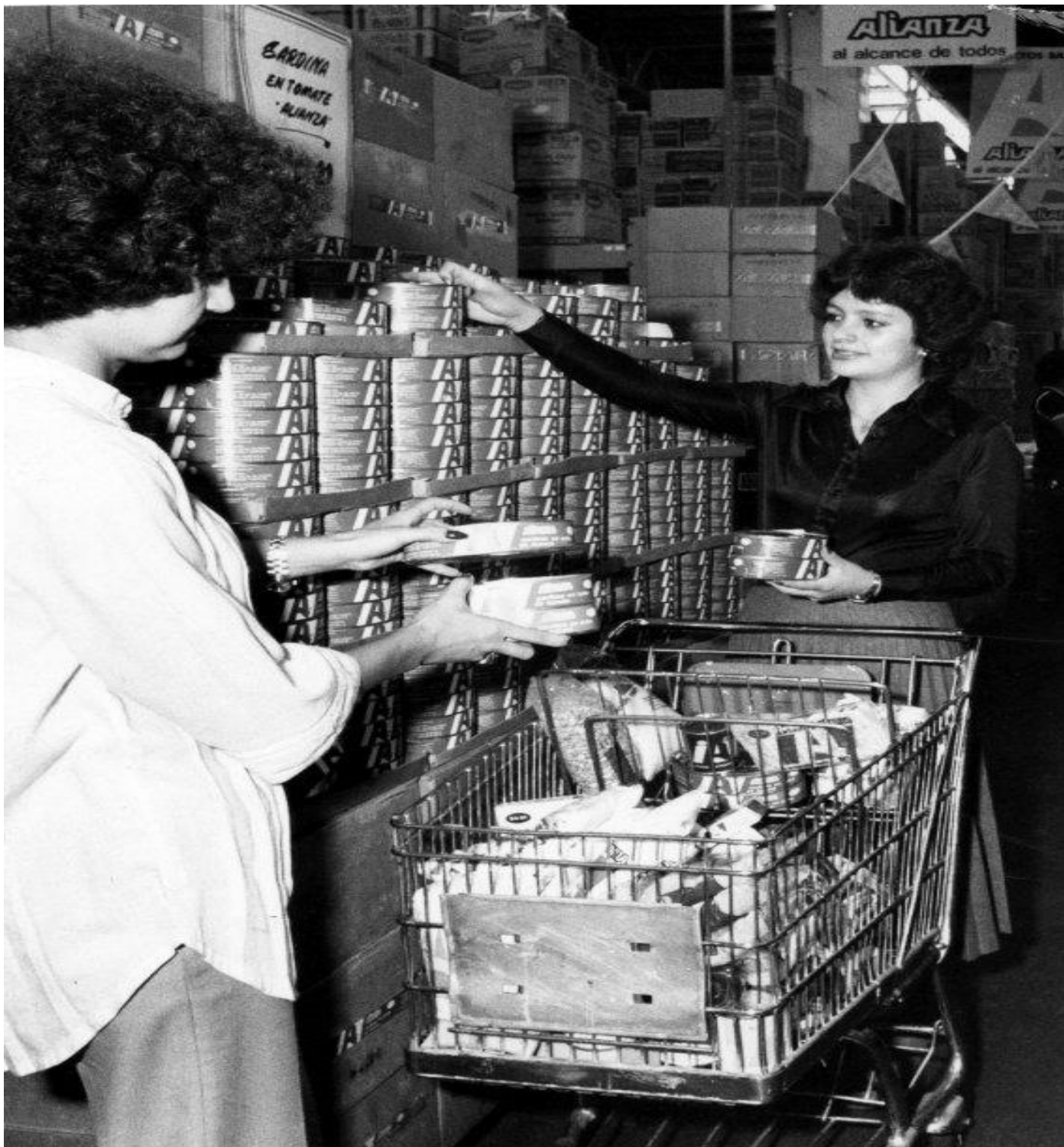
Imagen 5: Aída Castro Sánchez, “La Conasupo era la tienda del pueblo”, El Universal. 24 de julio de 2020.

La principal función de este tipo de tiendas era poder regular los precios de la canasta básica, por lo que las personas encontraban productos más baratos.