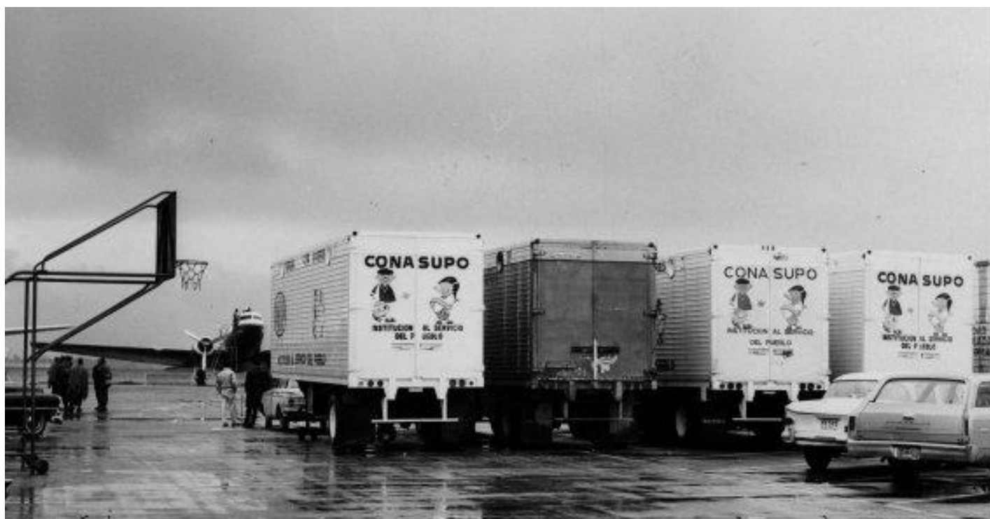
Imagen 2: Aída Castro Sánchez, “La Conasupo era la tienda del pueblo”, El Universal. 24 de julio de 2020. Archivo y Hemeroteca de El Universal.

Camiones que fungían como tiendas móviles de la CONASUPO.