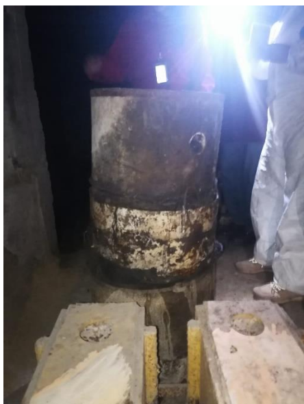
Pilotes bajo Palacio Nacional.