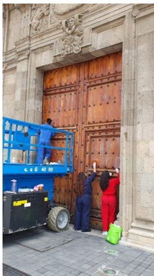
Trabajo en los portones.