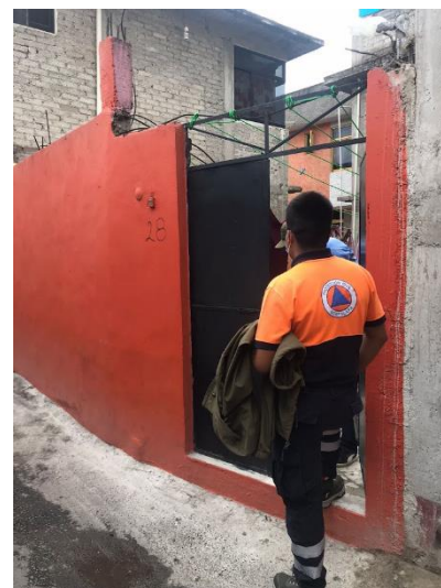
Fotografía 7: Evaluación a casa habitación.

Dentro de las metas alcanzadas es la aplicación de los conocimientos obtenidos a lo largo de la carrera, como lo es el comportamiento de las estructuras, ante algunas fallas, ya sean por algún fallo constructivo o por modificaciones han repercutido a las mismas, de igual forma el entendimiento del tipo de estructuras utilizadas en distintas construcciones, el uso de distintos tipos de cubiertas y materiales utilizadas en las mismas, el comportamiento de cimentaciones dependiendo los tipos de suelos, el uso de las técnicas constructivas que son utilizadas, al igual que los materiales de estas. E uso de aquellos tecnicismos que son entendibles dentro de un área de análisis de algunos fallos en viviendas o construcciones, que si bien, son solo revisiones técnicas visuales, no van más allá de un estudio a fondo del comportamiento de los fallos son entendibles entre el personal que realiza dichas evaluaciones.