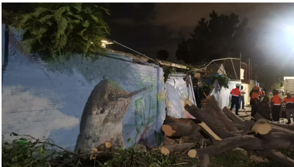
Fotografía 6: Evaluación ante una emergencia por caída de elemento forestal.

De igual forma el aprendizaje de forma administrativa, en el cual se debe de llevar encontró en todas las áreas, ya sean internas y externas y cada documento que entra y sale debe de estar registrado y ordenado de una forma correcta para la agilización de los tramites que se deban de llevar a cabo.