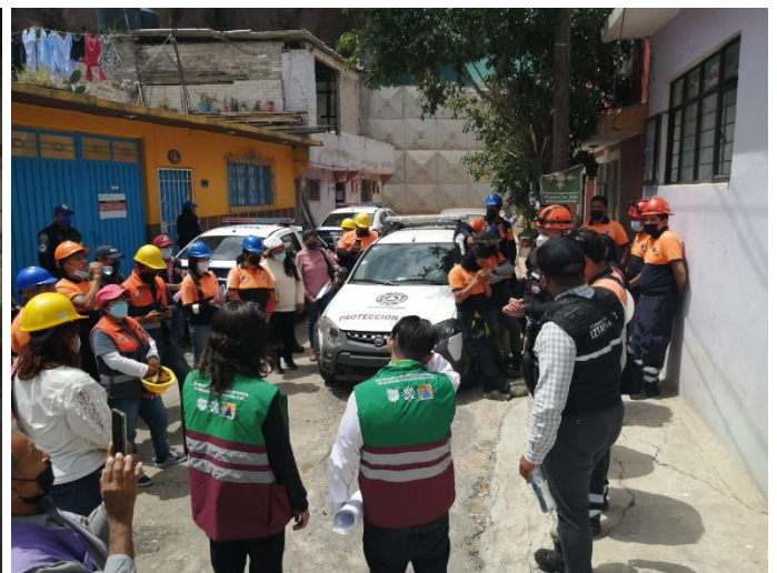
Fotografías 1 y 2: Obtenidas por personal de Protección Civil en la alcaldía Iztapalapa, en donde se visualizan realizando actividades de emergencia, así como actividades cotidianas como son en su mayoría revisiones a casa habitación