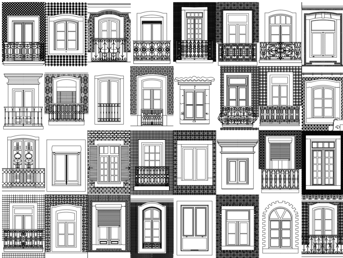
IMAGEN 3: "Ventanas en la Arquitectura"