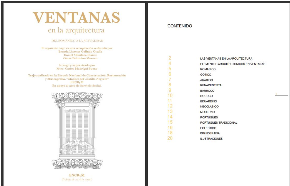
IMAGEN 5: Presentación y Tabla de contenidos del proyecto "Ventanas en la Arquitectura"