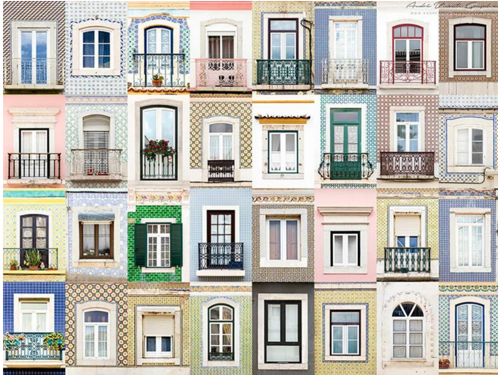
Goncalves, A. V., (sin fecha). Windows of the World Collections [imagen]. [Consultado el 23 de mayo de 2024]. Disponible en: https://www.andrevicentegoncalves.com/photography-project/windows-of-the-world-collections