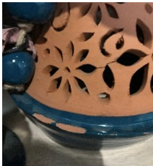
Imagen 2, restauración de pieza de barro