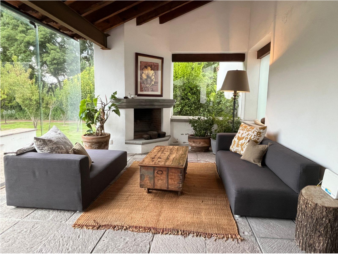
Imagen 14, cojines para cliente de Taller LU'UM