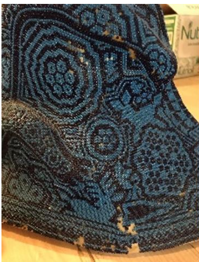
Imagen 1, restauración de alebrije