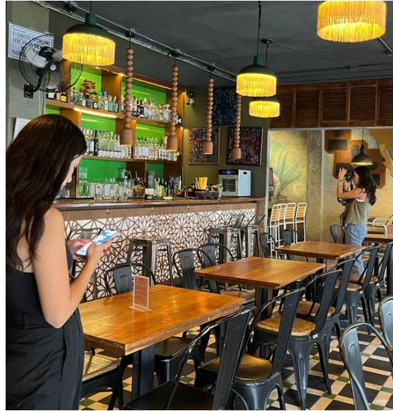
Imagen 11, sesión de fotos a producto