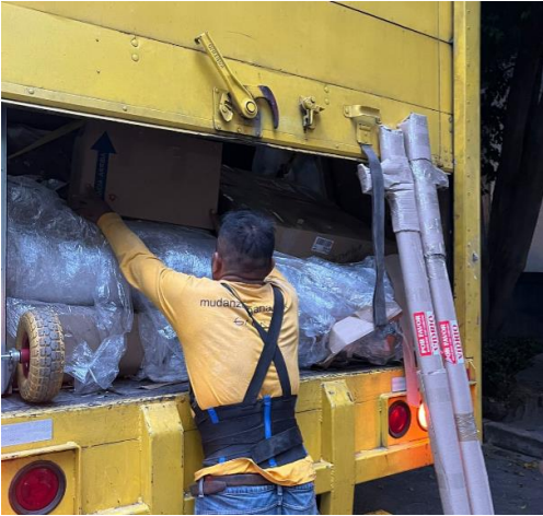
Imagen 10, logística