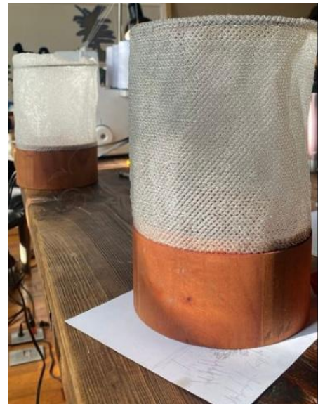
Imagen 13, tejido de luminarias