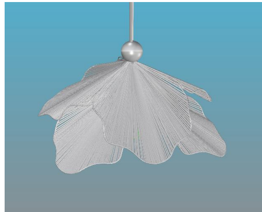
Imagen 7, propuesta de luminaria para la colección X de Taller LU'UM