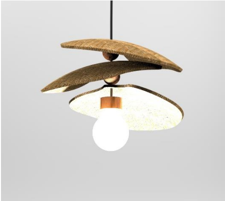
Imagen 6, propuesta de luminaria para la colección X de Taller LU'UM