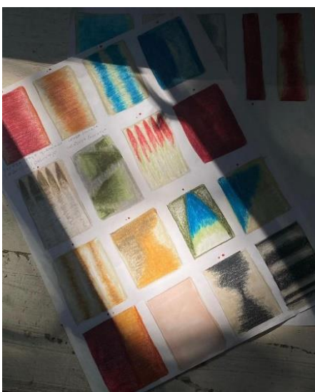
Imagen 3, bocetos para ideas de tapetes