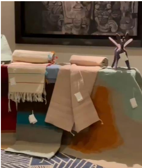
Imagen 12, exposición en Hotel Four Seasons