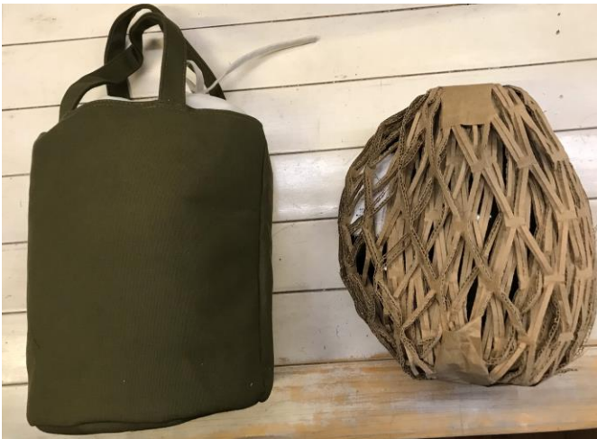
Imagen 8, empaque para Taller LU'UM