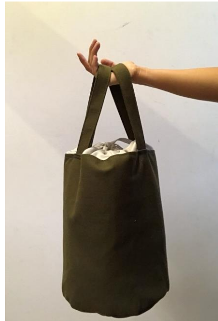
Imagen 9, empaque para Taller LU'UM