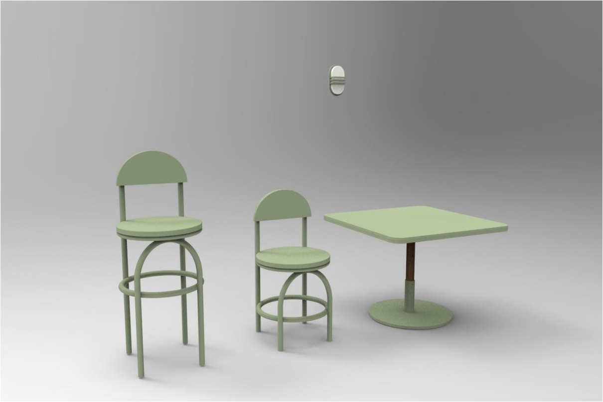
Imagen 4, propuesta de mobiliario para “La Tía”