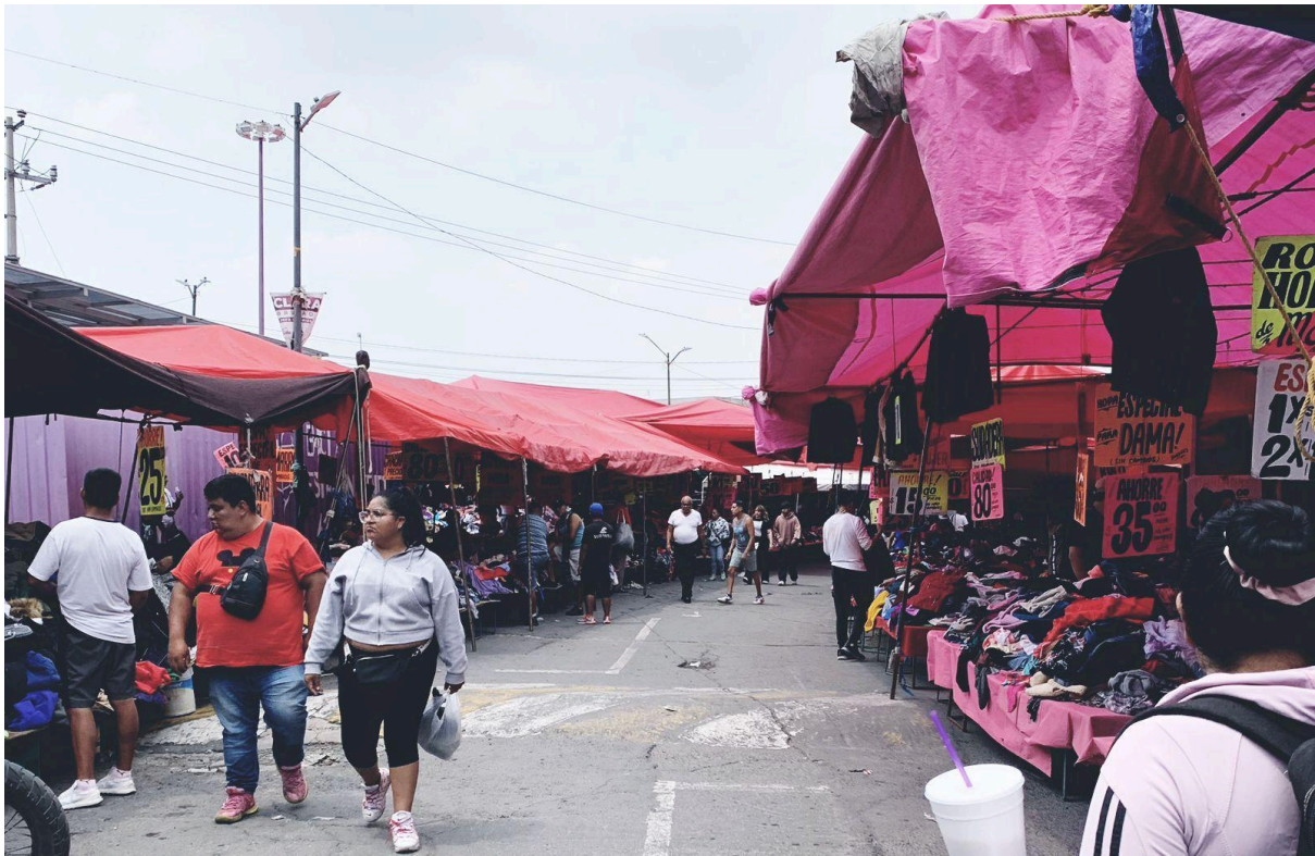
Fotografía 1. Elaboración propia.