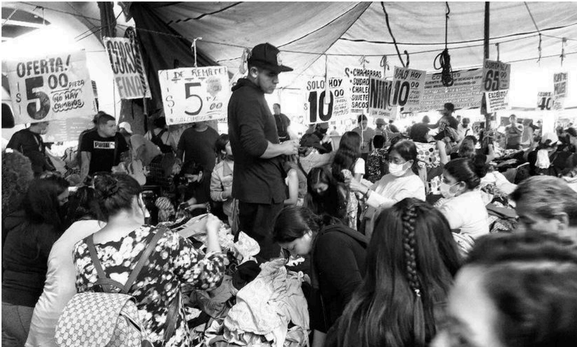
Imagen 2. Ehecatl (2022).

La relación entre comerciantes y autoridades es un aspecto fundamental en el desarrollo económico y social de cualquier comunidad. Esta relación se manifiesta en diferentes niveles y puede influir en el bienestar de los comerciantes. La presencia de autoridades en el tianguis es esencial para garantizar un orden y el cumplimiento de normativas que permitan la convivencia entre comerciantes y consumidores. Sin embargo, esta interacción frecuentemente se ve marcada por tensiones. Por un lado, los comerciantes suelen percibir a las autoridades como agentes que imponen restricciones que afecta a su actividad diaria. Mientras que, por otro lado, las autoridades tienen la responsabilidad de garantizar la legalidad y el orden en el espacio público. Su percepción de los comerciantes puede variar; algunos ven en ellos aliados en el desarrollo económico local, mientras que otros pueden considerarlos como elementos que generan desorden o legalidad. Además, la percepción pública sobre las autoridades también juega un papel crucial. En muchas ocasiones, los comerciantes, al sentirse vulnerables ante la acción de las autoridades, pueden desarrollar una imagen negativa de ellas, asumiendo que están más interesados en sus intereses que en fomentar un ambiente propicio para el comercio.