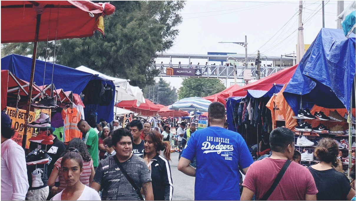
Fotográfica 3. Elaboración propia.