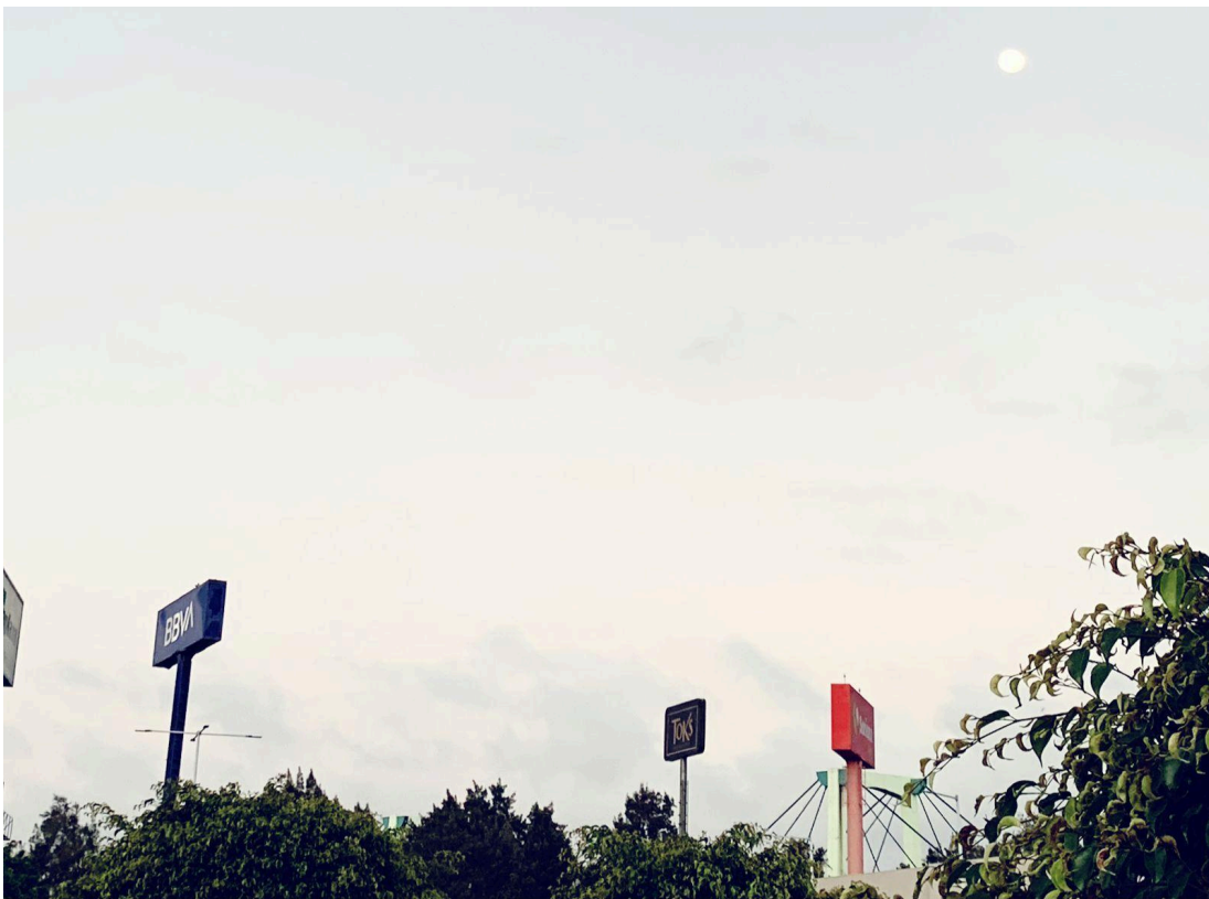
Fotografía 2.

veo un Toks, Pizza Dominos, Bancos, Soriana, Salones de Belleza y varios establecimientos, eso sí, estos lugares tienen un estacionamiento enorme que conectan con el tianguis. Pude deducir que, uno que otro comerciante que levanta temprano sale de este mismo estacionamiento, entonces no solo es para los que llegan a la plaza o al tianguis a comprar, sino también para los comerciantes. Salí de ese lugar y nuevamente estoy caminando sobre el tianguis, miró hacia arriba y puedo observar la estación del metro de Acatitla, es una vista buena, uno parándose justo en medio puede ver a los comerciantes, la gente y el metro. Después de cinco minutos más de estar ahí, decidí retirarme del lugar.