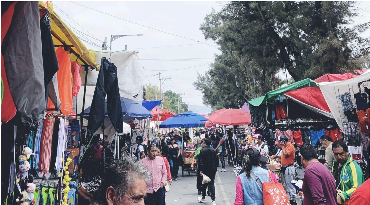
Fotografía 4. Elaboración propia.