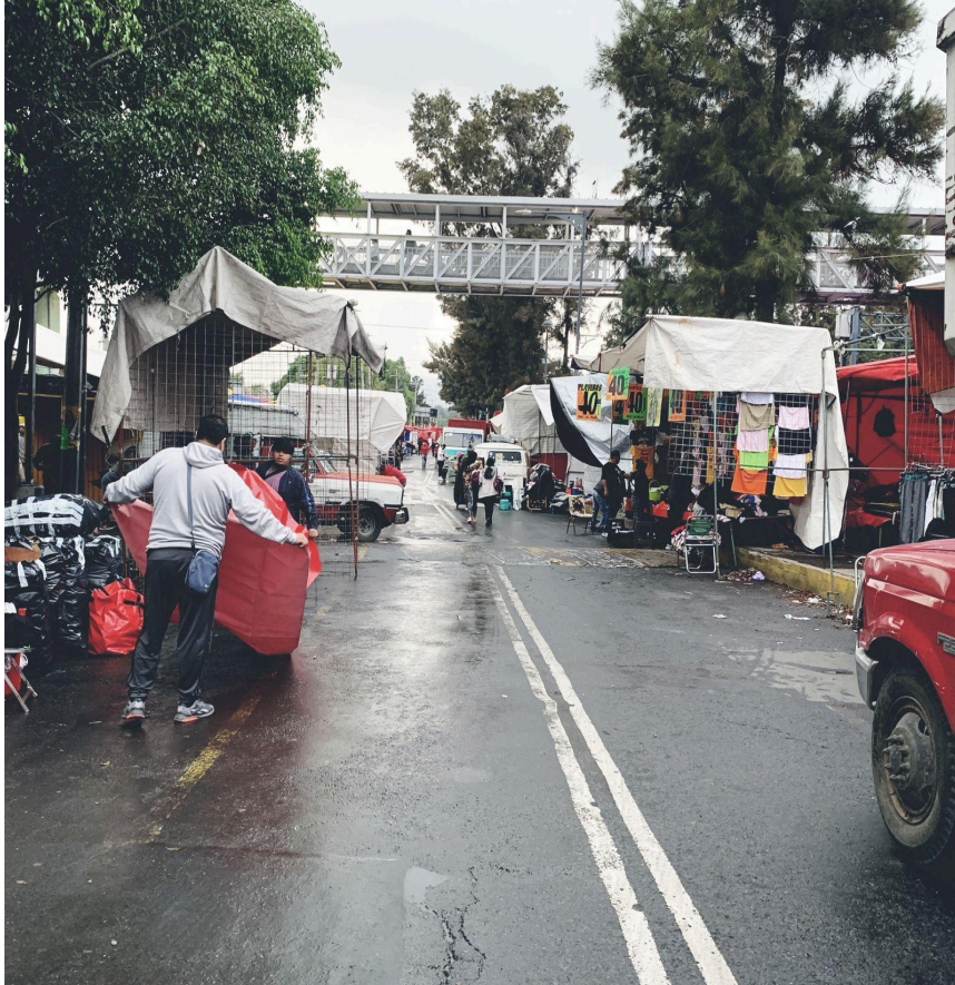
Fotografía 1.

“El beneficio que nos trajo a mí y a mi esposa fue que pues, a nosotros no nos cobraban, ni actualmente nos cobran la plaza y esto solo era por avisarles...tienen un complot los delegados conforme a los lugares ya que les cobran y se encargan de que los comerciantes no tengan problemas... las otras personas que cobran el lugar (las del otro mundo), ellos según cuidan pero no del todo es cierto eso, ellos tienen chanchullo con los delegados de aquí, entonces es lo mismo... las otras personas que cobran pues, según apoyan en que no nos moleste nadie, no se si sus compañeros de otras plazas raras...” 11