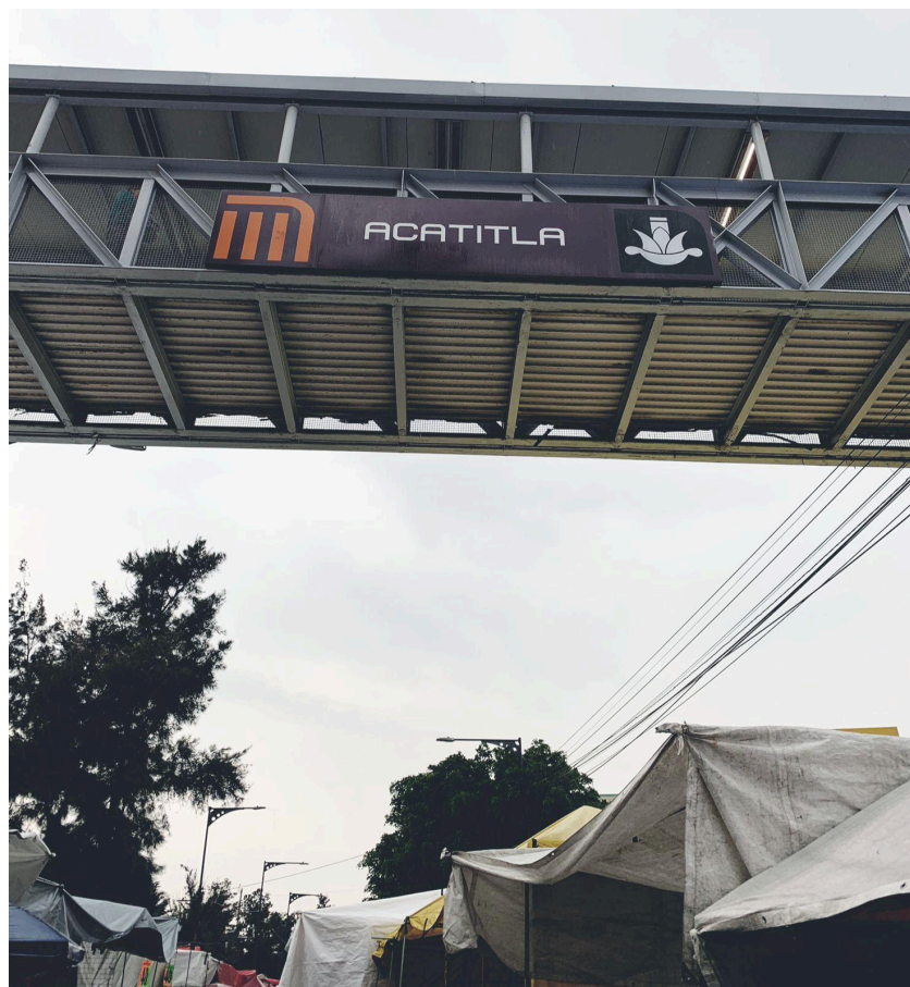
Fotografía 5. Elaboración propia.