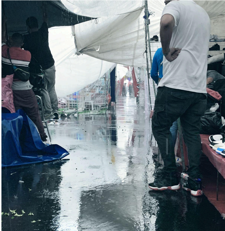
Fotografía 2.

disminución de inversión y de negocios plantados. Por lo que de cierta forma, los comerciantes, se ven obligados a operar en condiciones adversas que limitan su capacidad de crecimiento. Este fenómeno no solo afecta la estabilidad económica de los negocios, sino que también contribuye a un clima general de miedo y desconfianza entre los comerciantes