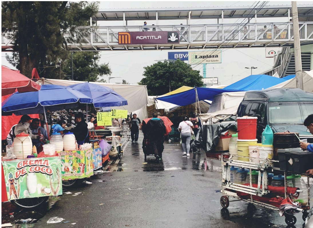
Fotografía 3. Archivo personal.

“decidimos cambiar la venta de comida a las micheladas, pero ya no poníamos puesto, ahora lo que hicimos fue abrir nuestro zaguán y empezar a vender dentro de nuestra casa... Luego luego nos dimos cuenta que jalaba mucha gente las cervezas y los baños, después vimos que los que ingresaban al baño eran familias completas y nos preguntaban por bebidas para niños, a lo que despues tambien incluimos refrescos, jugos, sopas maruchan y dulcería para botanear en lo que estaban en el lugar... también puedo ver que nuestra estabilidad aquí, por lo menos si va para unos años más y me agrada saber eso...” 21