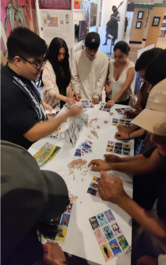
Figura 1. Fotografía de las activaciones realizadas en las actividades del Museo a través del bingo de resistencia. Fuente: Elaboración propia. 2024.