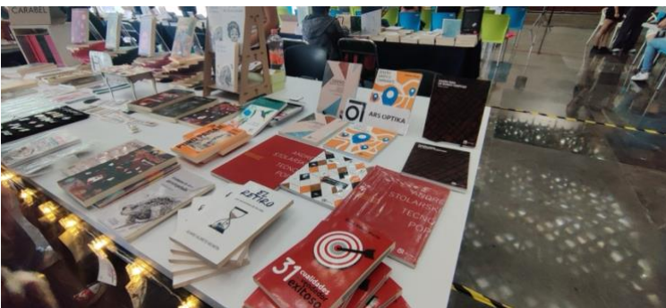
Figura 2. Fotografía de la Feria del libro y la Rosa. Fuente: Elaboración propia. 2024.