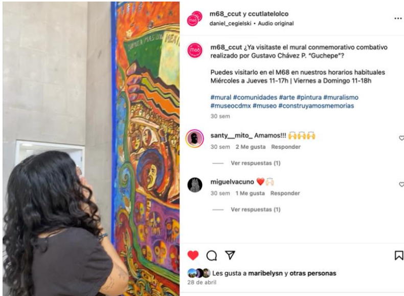
Figura 8 . Publicación sobre la inauguración del mural colectivo. Fuente: https://www.instagram.com/p/C6UNst4OBto/ . 2024