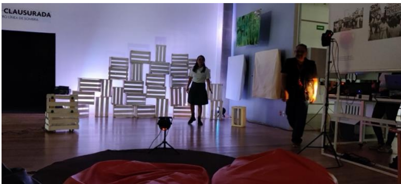
Figura 4. Fotografía de presentación teatral sobre la violencia a la mujer. 2024.