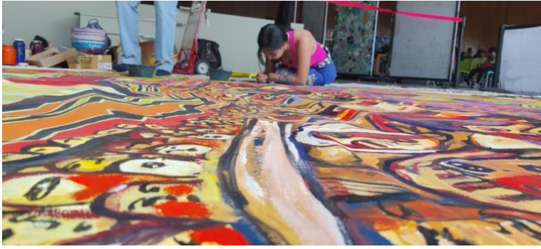
Figura 3. Fotografía de la realización del Mural colectivo en conmemoración de los zapatistas por el artista Guchepe. 2024