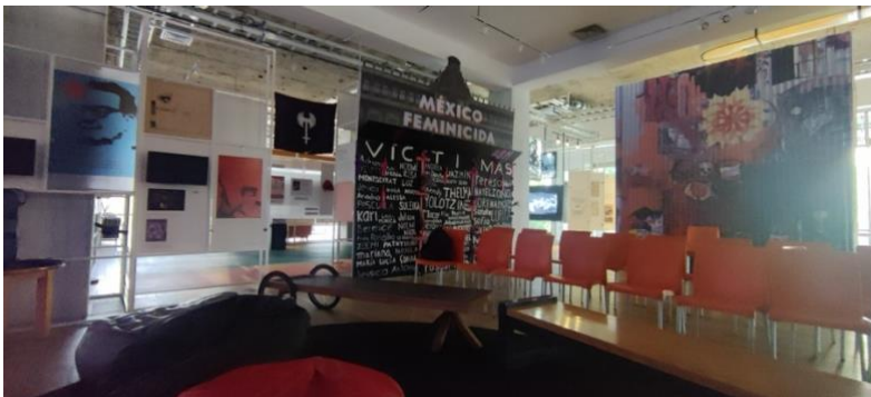
Figura 5. Fotografía de la inauguración de la exposición México Feminicida en conjunto a la obra teatral. 2024.