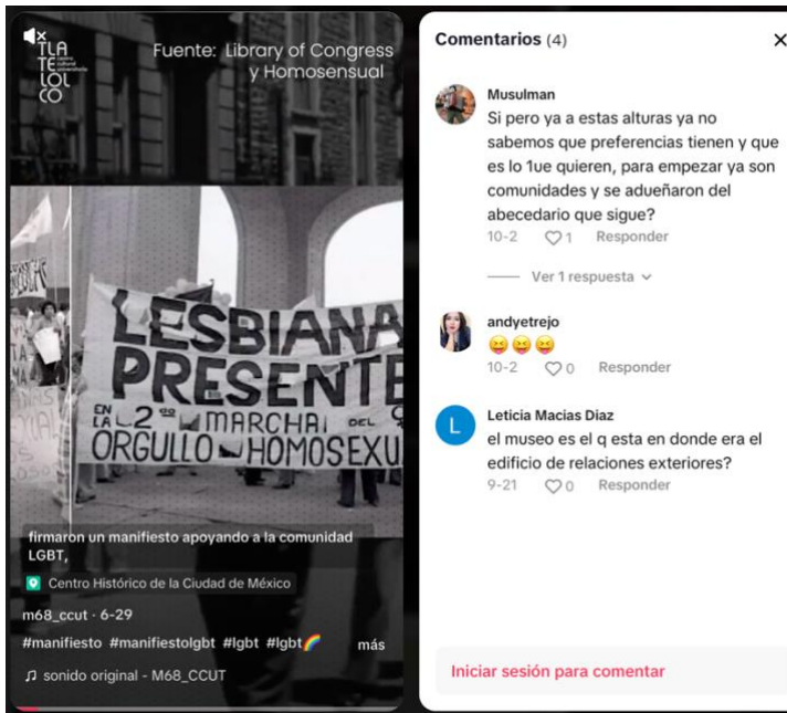
Figura 6. Vídeo documental realizado acerca del primer manifiesto lgbtiq+ en México realizado para el mes de Junio de orgullo lgbtiq+. Fuente: https://www.tiktok.com/@m68_ccut/video/7386116954551061766