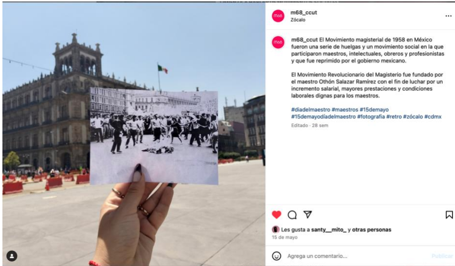
Figura 10. Resignificación de fotografías del acervo en contextos actuales. Fuente: https://www.instagram.com/p/C6_0WwD0mUF/ . 2024.