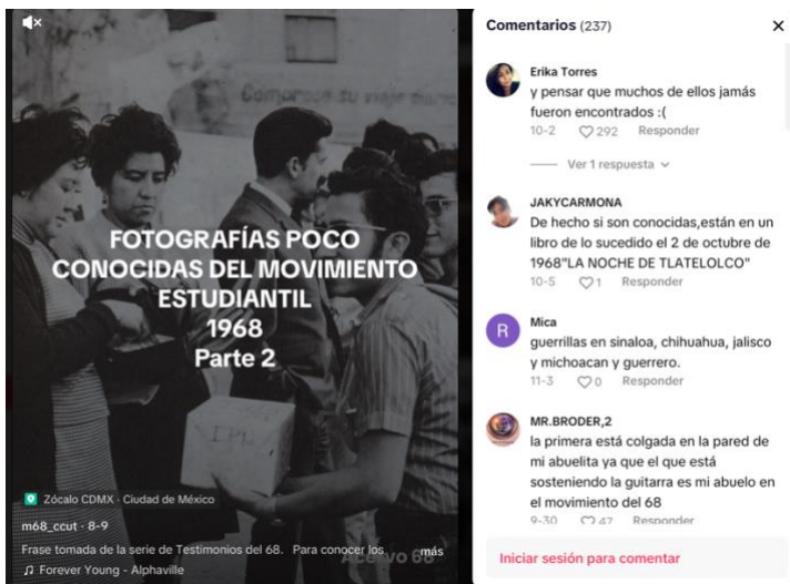
Figura 7. Publicación realizada con fotografías del acervo del museo con el objetivo de difundir el material. Fuente: https://www.tiktok.com/@m68_ccut/photo/7401351194649595141 . 2024