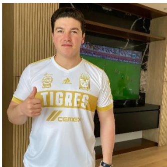
Imagen de un aficionado al equipo de futbol Tigres, donde demuestra su apoyo al equipo con una camisa del club y permitiéndose observar el partido para alentar como un hincha más.

esto de manera indirecta serian puntos que sumaban a su campaña y a su imagen en el colectivo público. Estas acciones lograban que el público simpatizante del equipo tigres tuviera reacción en favor de SG, al ser un aficionado ferviente del equipo el pueblo podría simpatizar de manera mas directa con su persona e interesarse por lo actuar como candidato.