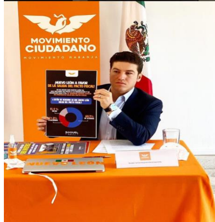
Imagen de un joven representante de partido, cobijado por los colores de su movimiento, resaltando el mensaje de propuesta con dirección de precampaña

Nuevo León necesita un nuevo trato fiscal, ya basta de maltratos de la Federación, ya basta recibir migajas.