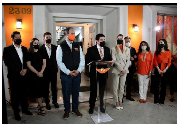
Imagen de un joven rodeado de militancia de su partido y parte de los ejes centrales de campaña, como lo es Mariana Rodríguez en el acompañamiento discursivo y de apoyo.

El 5 de marzo de 2021 Samuel García presentaría formalmente el inicio de su campaña para ser electo gobernador de Nuevo León, este hecho se realizaría desde la casa de campaña de Movimiento Ciudadano, la publicación que acompañaría el anuncio oficial de la campaña mantendría diferentes directrices, mencionando su integridad ante la corrupción que se ha suscitado en el estado de parte de diversos partidos, dejando menciones claras de su vida, tales como esta: “Soy el único que no tiene nada que esconder: toda mi vida es transparente, yo no oculto a mi familia, ni ando protegiendo a corruptos, ni tengo padrinos.”, (Rescatado del Instagram de Samuel García, 2021), la publicación realizada no solo servía para dar a conocer públicamente su campaña, también funcionaba para destacar puntos que de alguna manera le daban ventaja ante sus adversarios, estos se mencionan a continuación: