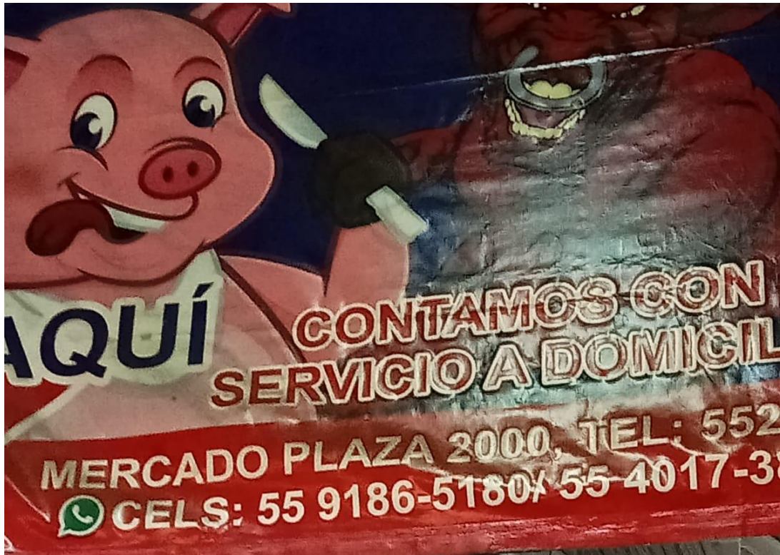
Foto: Anuncio (Interior mercado de Carnes), por Yolanda Merary Núñez Venancio, Base estacionamiento, 20 de abril de 2023.