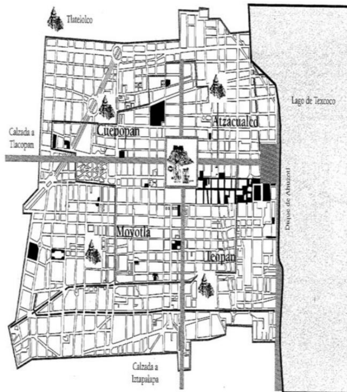
Fuente Tena y Urrieta (2009), ubicación de los cuatro templos y sus templos principales.

Estos templos eran, al noreste Cuicopán, al suroeste, Moyotlán, al noreste, Atzacualco y al sur Teopán -que constituía por sí mismo una célula parcialmente autosuficiente-; cada una contaba con un centro ceremonial donde se veneraba a una deidad diferente y a su alrededor se llevaban a cabo actividades culturales y económicas, de manera independiente, y que podían ser ejecutadas gracias a la división de barrios o calpullis. (Tena y Urrieta, 2009, p. 47)