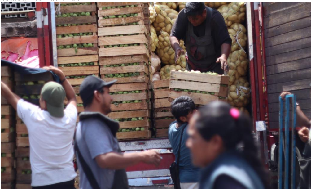
Foto: Diableros trabajando, por Núñez Venancio Yolanda Merary, Base estacionamiento, 09 de julio 2023.

Minutos más tarde, al salir del mercado encontramos al “Bola”, quien junto con otros diableros estaban descargando una camioneta para cargar sus diablitos, saludamos y les pedimos permiso para poder fotografiarlos, ellos con amabilidad nos dijeron que sí e incluso nos pidieron muy felices, tomarles fotografías en grupo. Así, cada integrante del equipo tomó turnos para fotografiar, ser asistente de cámara y los demás, tener un nuevo acercamiento con otros diableros quienes mostraron interés en lo que estábamos haciendo.