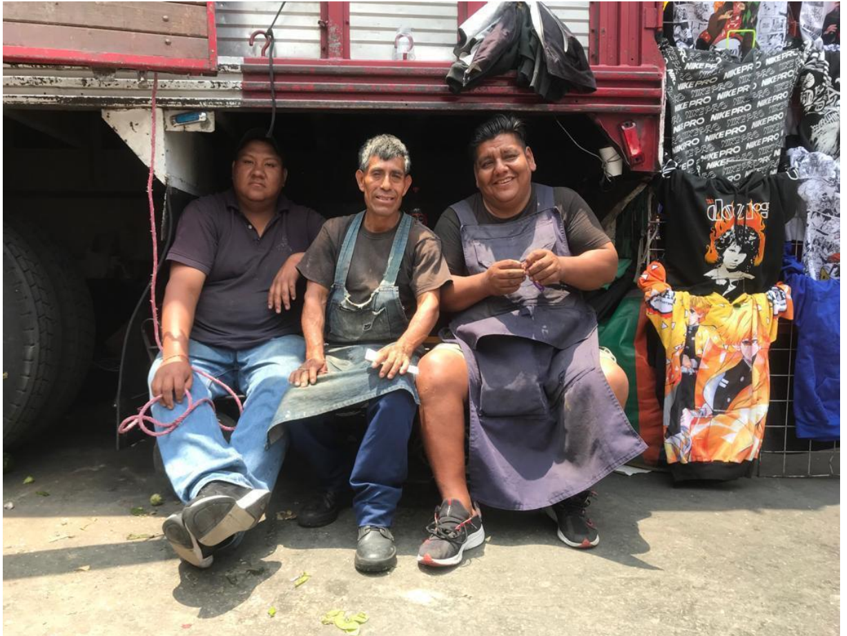
Foto: Diableros descansando, por Araceli Murillo Eulogio, Base estacionamiento, 12 agosto de 2023.

Como pudimos ver en este capítulo, los diableros son un recurso humano de vital importancia en el transporte de mercancías desde la época prehispánica hasta la actualidad, pues son los encargados de mantener el flujo comercial en este espacio económico, cumpliendo con el objetivo de ser una pieza fundamental previa a la distribución para la venta de productos en la Merced.