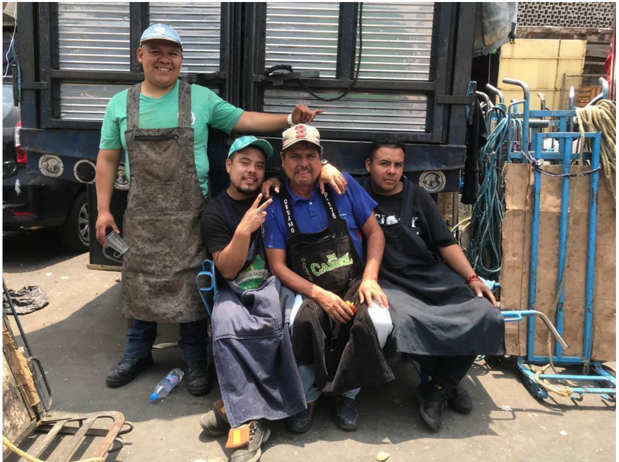
Foto: Diablos jugando, por Araceli Murillo Eulogio, Base estacionamiento, 12 de agosto 2023.