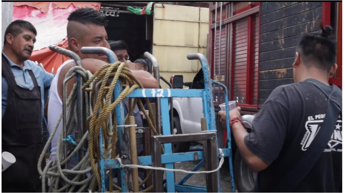
Base estacionamiento, 5 de agosto de 2023, Base estacionamiento.

quiere, pues él puede brincar, pues él es el jefe, pa pronto.” (Oliser Bolaños/”El Flaco”, 42 años, Base) 41