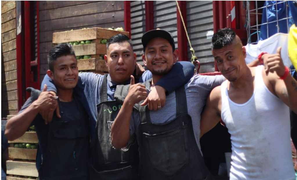
Foto: Diableros jugando, Base estacionamiento, 09 de julio de 2023.

También recorrimos los pasillos dentro del mercado con la misma dinámica de tener roles de producción, esto con la finalidad de checar y conocer mejor los espacios en los que vamos a trabajar. Asimismo, salimos a las calles aledañas al mercado. Al realizar este ejercicio así, nos dimos cuenta de que las dinámicas entre los espacios cambian mucho; es decir, los comerciantes de adentro se mostraban interesados y amables ante la cámara pero los de afuera nos observaban con cautela y mucha curiosidad, algunos incluso escondían sus rostros mientras que otros prestaban atención a la cámara. Y claro, las condiciones de luz, movimiento, de audio y de suelo cambian, por lo tanto tuvimos que ir adaptando las técnicas o “mañas” para seguir tomando fotografía.