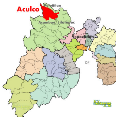
MAPA 2. Aculco en el estado de México.