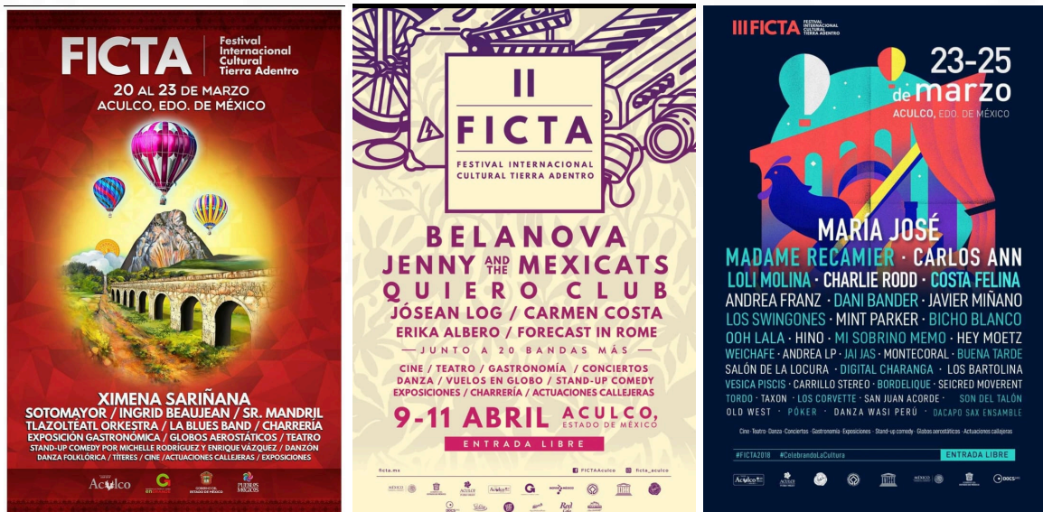
Carteles tomados de Facebook de la cuenta oficial “Festival Intercultural Tierra Adentro”

Dicho festival tuvo un impresionante éxito, de tal manera que en 2018 ganó el Premio IAPEM a la Gestión Municipal 2018, conforme la información del Instituto de Políticas Públicas del Estado de México y sus Municipios (IAPEM) en la edición del festival 2017, en redes sociales como Facebook se realizaron 36 post en este medio social durante el desarrollo de las actividades de FICTA 2017, con un alcance conjunto de 123 mil 488 personas (IAPEM, 2018).