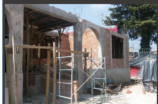
SUBDELEGACION STO. TOMAS AJUSCO