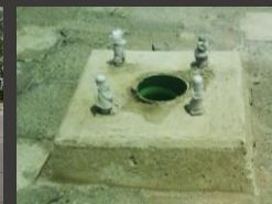
SEMAFOROS FUENTES BROTANTES