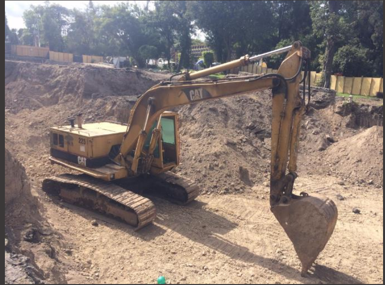
ESTACIONAMIENTO JUANA DE ASBAJE