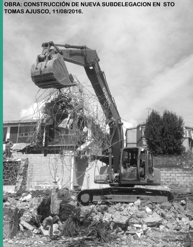
OBRA: CONSTRUCCIÓN DE NUEVA SUBDELEGACION EN STO TOMAS AJUSCO, 11/08/2016.