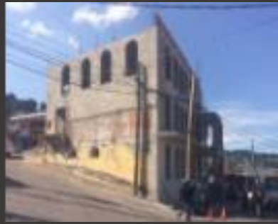
SUBDELEGACION MAGDALENA PETLACALCO