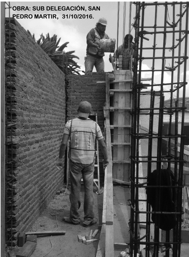
OBRA: SUB DELEGACIÓN, SAN PEDRO MARTIR, 31/10/2016.

Directora de la División de Ciencias y Artes para el Diseño, UAM Xochimilco