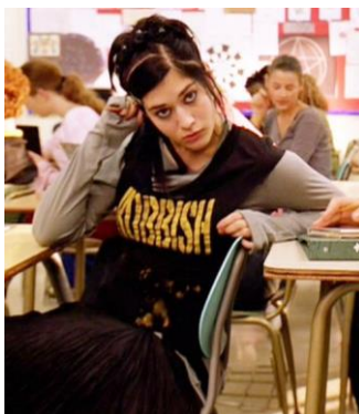
Imagen 2.9 Lizzy Caplan en Mean Girls (2004)