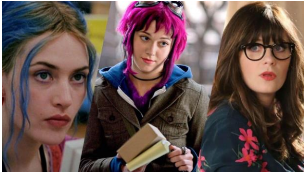
Imagen 2.4 Kate Winslet en Eternal Sunshine of the Spotless Mind (2004); Mary Elizabeth Winstead en Scott Pilgrim vs. The World (2010) y Zoey Deschanel en 500 Days with Summer (2009)

mostrar datos sobre la vida de ella o su personalidad, a pesar de que el protagonista esté locamente enamorado de ella.