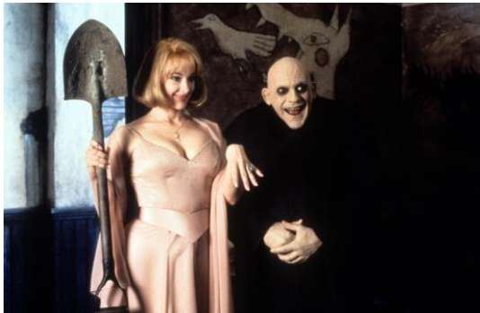
Imagen 2.8 Joan Cusack y Christopher Lloyd en Addams Family Values (1993)

aparece como una comparación a las arañas llamadas viudas negras, las cuales, ocasionalmente matan al macho después de aparearse para adquirir proteínas y otros nutrientes extras. Algunos ejemplos de este estereotipo en el cine aparecen en películas como Addams Family Values (1993) donde Debbie solo busca la fortuna de Fester.