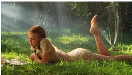
Imagen 2.6 Dominique Swain en Lolita (1997)

★ La mujer objeto de deseo: Donde la protagonista es joven, hermosa y soporta pasivamente la mirada del varón, como un florero, solamente está ahí para satisfacer sexualmente al sujeto masculino; a menudo se convierten en cuerpos fragmentados, donde las partes más deseables para el hombre (senos, piernas, nalgas, labios) son continuamente mostradas en pantalla. Convirtiéndose en un serio problema