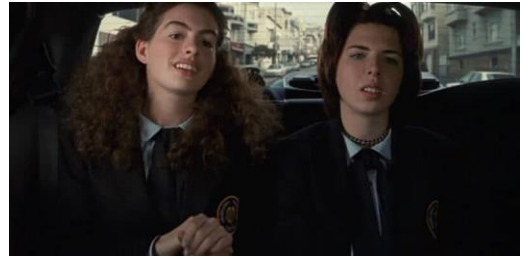
Imagen 1.4 Anne Hathaway y Heather Matarazzo en The Princess Diaries (2001)

4.- Mujer que no atrae a los hombres: Dentro de este arquetipo entran muchos tipos de personajes femeninos que, usualmente, cuentan con características que los hombres consideran negativas y poco atractivas. En muchas ocasiones estas características vienen arraigadas con los estereotipos de género que existen en la sociedad, indicando que al no cumplir estas normas, son menos atractivas. Características como una mujer poco femenina, comprometida más al trabajo que a la familia, intensa, apasionada, inteligentes, poco experta en temas sexuales, demasiado experta en temas sexuales, entre otras, son las que alimentan este arquetipo.