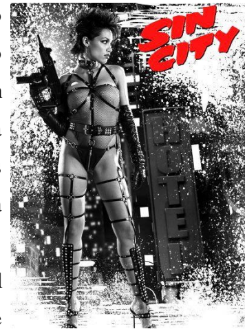
Imagen 2.5 Rosario Dawson en Sin City (2005)

★ La prostituta: Utiliza la explotación sexual de la mujer como un recurso habitual en la pantalla, ya sea romantizando o mostrándolo moralmente incorrecto. La mujer se convierte en un objeto de deseo y soporta la mirada activa del varón para obtener algún beneficio propio, normalmente dinero u objetos materiales. También hay algunos casos en los que la prostituta tiene un corazón de oro y “necesita” ser salvada por un hombre. Se puede ver en películas como Pretty Woman (1990) con el personaje de Vivian, en Sin City (2005) con el personaje de Gail o en Taxi Driver (1976) con el personaje de Iris.