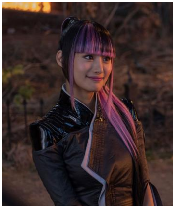
Imagen 2.13 Shioli Kutsuna en Deadpool 2 (2018)

★ Mujer migrante / Extranjera Exótica: Normalmente cuando aparecen mujeres latinas o asiáticas en el cine, se tratan de estereotipos de mujeres migrantes que van a trabajar a Estados Unidos o de extranjeras que son hermosas y exóticas por sus diferencias.