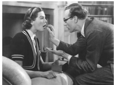
Imagen 2.2 Wendy Hiller y Leslie Howard en Pygmalion (1938)

De esta manera el estereotipo llega a la pantalla grande, donde un hombre moldea a una mujer para convertirla en “la mujer perfecta”. El ejemplo más claro se encuentra en la película Pygmalion (1938), donde el profesor Higgins busca convertir a una joven vendedora de flores en una dama de alta sociedad; también podemos verlo en Pretty