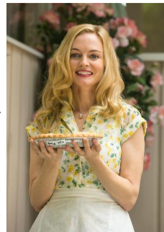
Imagen 1.1 Heather Graham en Flowers in the Attic (2014)

Tres ejemplos sumamente diferentes de este arquetipo son mostrados en películas como Flowers in the Attic (2014) donde el personaje Corrine Dollanganger, es el prototipo de esposa ideal estadounidense; en Grease (1978) con Sandy, una adolescente hermosa, tierna e inocente; o en The Avengers (2012) donde el personaje Black