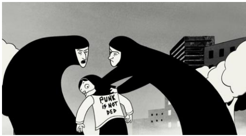
Imagen 2.14 Fotograma de Persepolis (2007)

también pueden tener vidas personales plenas, mujeres que luchan y prosperan con sus hijos y con su trabajo, mujeres que se compromete socialmente y/o rompe los esquemas de