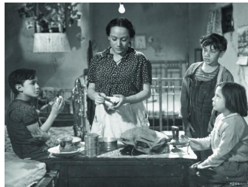
Imagen 2.1 Los Olvidados (1950)