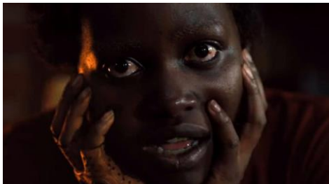
Imagen 1.5 Lupita Nyong'o en Us (2019)

5.- Mujer “minoría”: Una gran parte de las mujeres en el cine son jóvenes, hermosas y blancas; marcando una centralización de papeles y de historias en el cine, haciendo al mismo tiempo que las minorías sean más marcadas y estereotipadas en el cine.