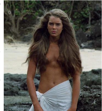
Imagen 1.2 Brooke Shields en The Blue Lagoon (1980)

2.- Mujer sexualizada: El cine, al igual que cualquier otra industria audiovisual, somete a la mujer continuamente en un proceso de cosificación sexual, convirtiéndolas en adornos para la satisfacción masculina, dejando de lado el desarrollo del personaje, su personalidad y criterio, incluso convirtiéndolas en “tontas”, para minimizar sus papeles y dedicarse a mostrar continuamente diferentes partes de su cuerpo, tanto en mujeres adultas como en adolescentes y, preocupantemente, incluso en niñas pequeñas.