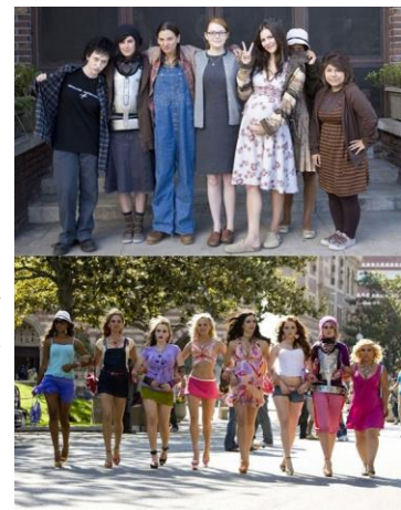
Imagen 2.15 Cast de The House Bunny (2008), antes y después

Uno de los ejemplos más claros en el sector audiovisual se encuentra en la supuesta equivalencia de la capacidad intelectual con la belleza de las mujeres, marcando dos grandes estereotipos que suelen contraponerse en papeles protagónicos de una película. Por un lado la mujer hermosa que es “una cabeza hueca”, en contraposición con la mujer “fea” que es super intelectual e incluso artística; marcando una clara rivalidad entre ellas entrando a su vez en el cliché de que las mujeres se pelean, se envidian y siempre están una en contra de la otra.