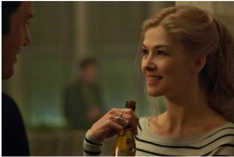
Imagen 2.3 Rosamund Pike en Gone Girl (2014)

“Los hombres siempre usan esa palabra como el máximo cumplido. ‘Es una chica cool’. La Chica Cool es sexy, está dispuesta, es divertida, jamás se enfada con su hombre, solo sonríe con desazón, amorosamente y ofrece su boca para el sexo. Le gusta lo que a él le gusta. Como a él, le gusta el porno, habla de fútbol y soporta las alitas búfalo en Hooters. Cuando conocí a Nick Dunne, supe que