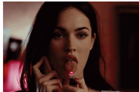
Imagen 2.7 Megan Fox en Jennifer's Body (2009)