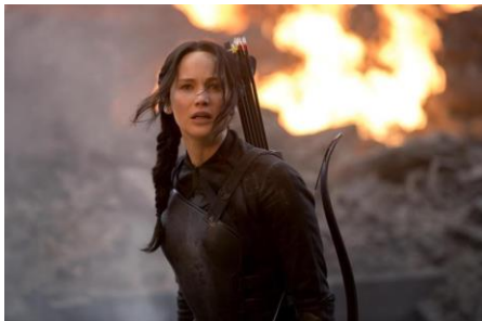
Imagen 1.3 Jennifer Lawrence en The Hunger Games: Mockingjay - Part 1 (2014)

3.- Mujer hermosa pero dominante: Este arquetipo de mujer se refiere a las personajes