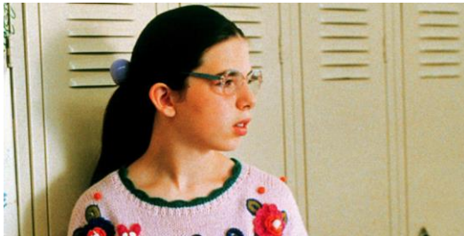
Imagen 2.10 Heather Matarazzo en Welcome to the Dollhouse (1995)

las chicas bonitas y populares son sexualmente activas y las chicas consideradas “feas” suelen ser virgenes, inadaptadas sociales. Un claro ejemplo está en la película Never Been Kissed (1999) con el personaje de Josie; o en Welcome to the Dollhouse (1995) donde Dawn Wiener desea dejar de ser virgen.