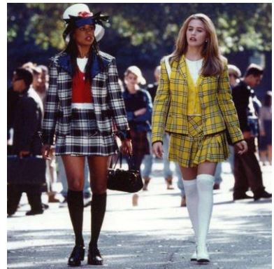
Imagen 2.12 Stacey Dash y Alicia Silverstone en Clueless (1995)

★ Mujer afroamericana, empoderada, descarada: Un estereotipo muy común en las películas de Hollywood es la mujer negra, usualmente es compañera de la protagonista, una consejera descarada y divertida que no pierde oportunidad para decir un chiste o algún comentario sarcástico. Algunos ejemplos de este arquetipo en el cine se encuentran en películas como Clueless (1995), con el papel de Dionne; o en High School Musical (2006) con Taylor McKessie