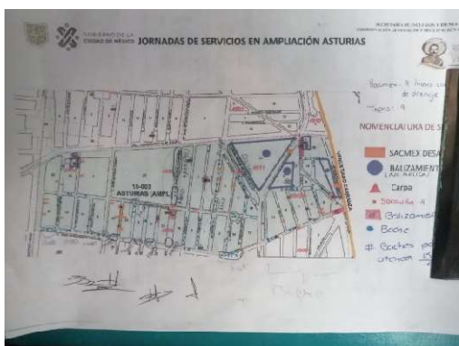
Scouting Colonia Asturias. (2022).