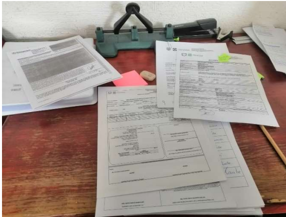
g Corroboración de texto informativo