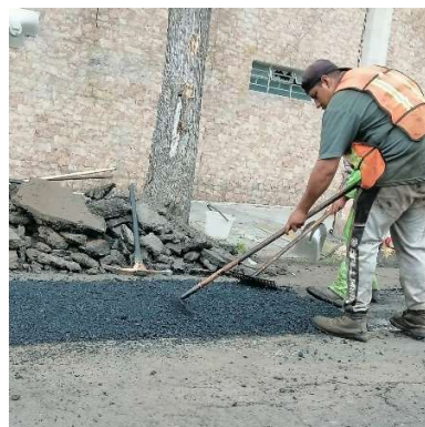
Bacheo calle secundaria.