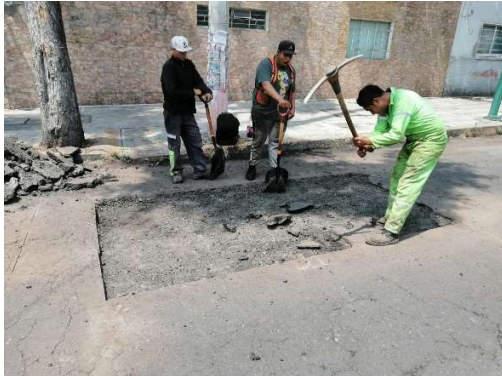
Levantamiento de Pavimento. (2022).