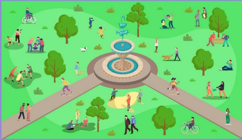
SUBDIRECCIÓN DE SEGURIDAD VIAL Y PREVENCIÓN DEL DELITO