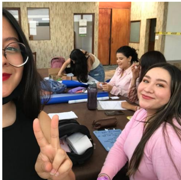
Foto tomada en la asamblea #3, el 2 de diciembre del 2022, día en el que se llevó por primera vez la caja anónima:

Foto tomada en el momento que se estaba realizando la caja anónima: