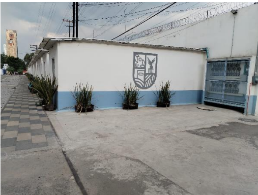
Comparación del cómo se veía antes y después