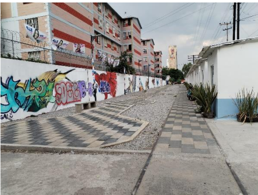
Vista frontal de como se ve el callejón unos meses después