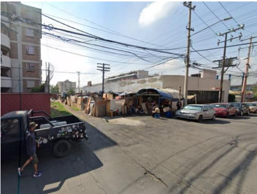
Parte frontal del cómo se veían las casas de madera y lamina