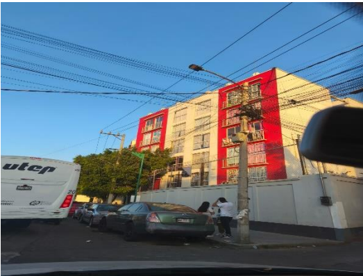
Unidad Habitacional Fresno 409, aquí fueron reubicados las personas que estaban sobre las vías