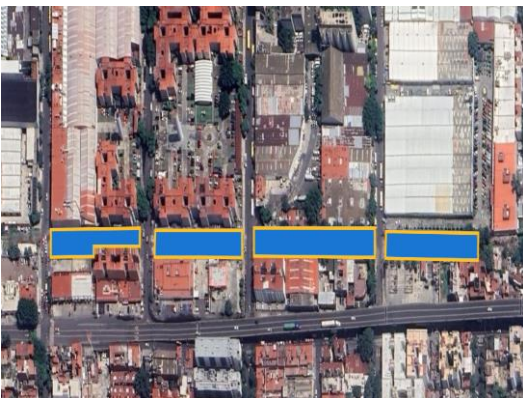
Este es el alcance que se iba a trabajar en este proyecto de vivienda