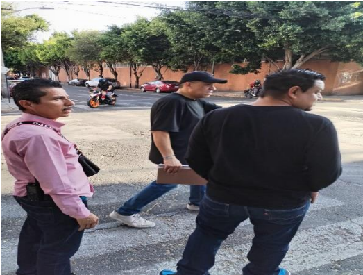
Visita con los de planeación territorial y el presidente vecinal