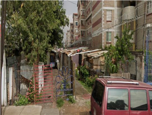
Fotografía de antes de que se empezará a trabajar