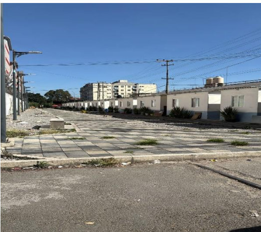
Fotografía de como se ve actualmente