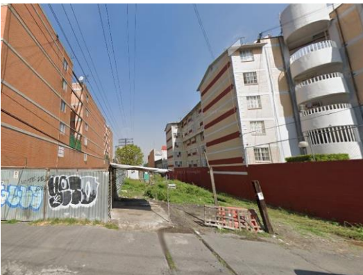
Fotografía de antes de que se empezará a trabajar