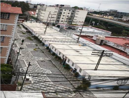
Proyecto terminado de las viviendas de que se realizaron en la calle de Naranjo