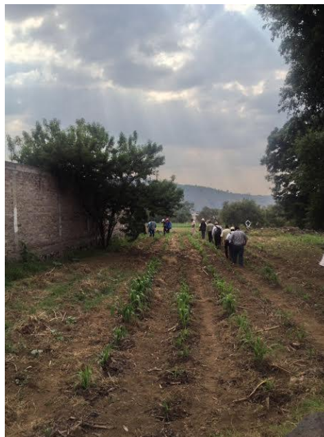
Recorridos a diversos puntos de la delegación Xochimilco.