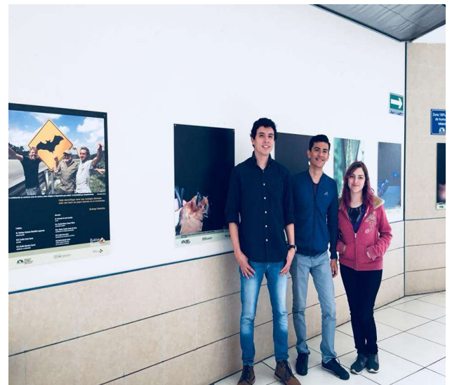
Anexo 5: Equipo de servicio social junto al montaje de la exposición "murciélagos"