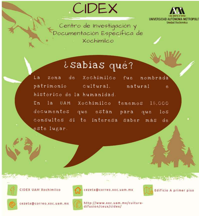
Anexo 2: Diseño del cartel de difusión del CIDEX en la feria de servicio social