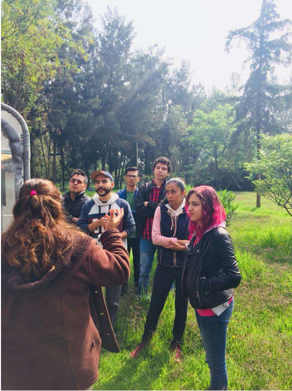
Anexo 6: Equipo de servicio social en la visita al CIBAC