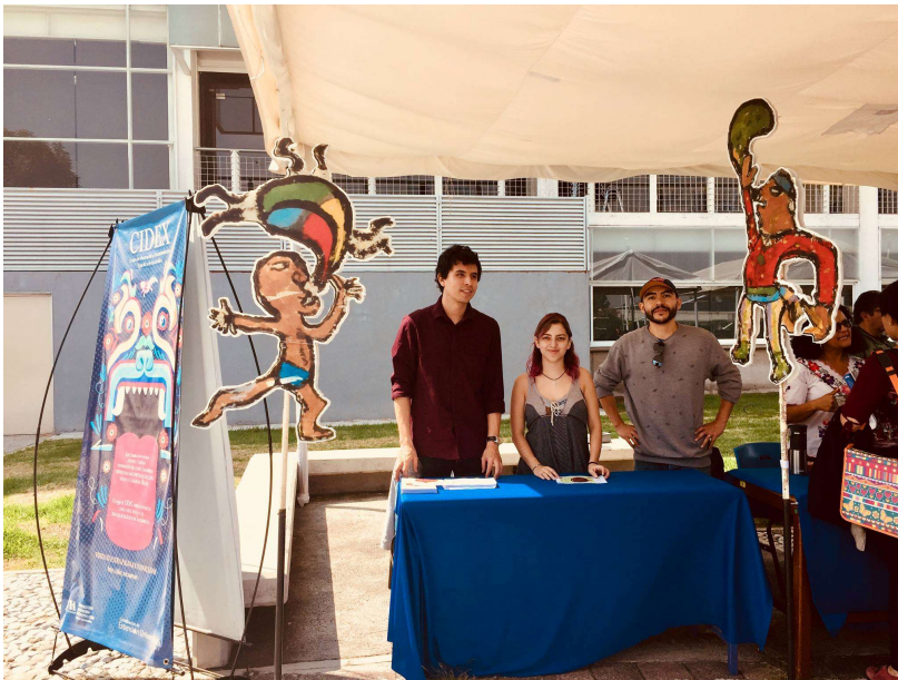
Anexo 1: Equipo de servicio en la feria del servicio social en UAM-X