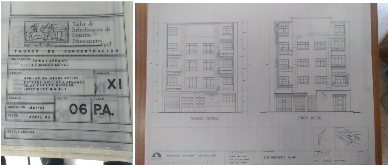
Fotografías 1 y 2: Planos para digitalizar