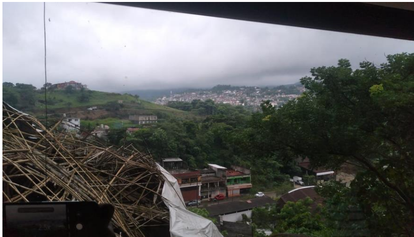
Fotografía 3: Municipio de Cuetzalan

Fotografía que muestra parte del municipio de Cuetzalan, en la zona montañosa del norte de Puebla.