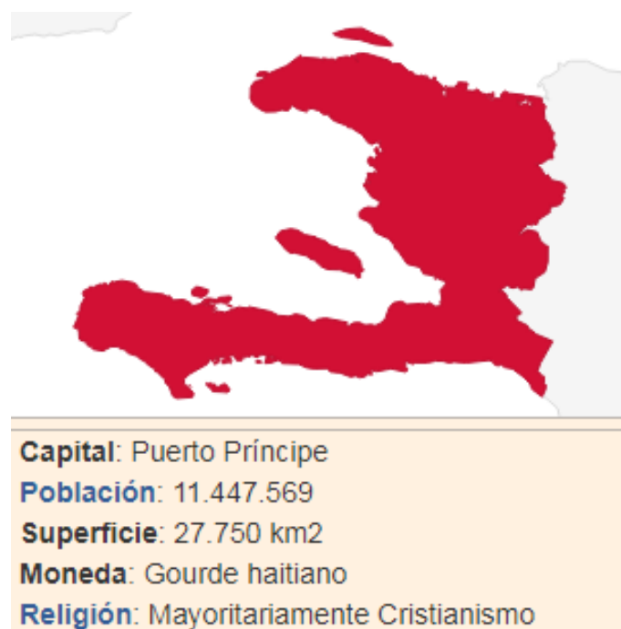
Imagen1. Mapa de Haití con características principales.