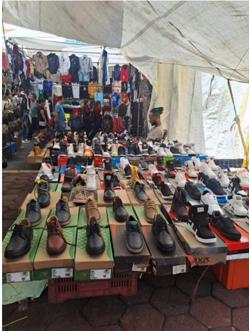
Imagen 5. Migrante cuida la mercancía

Tomada el 1 de agosto del 2024 en la Avenida de las torres