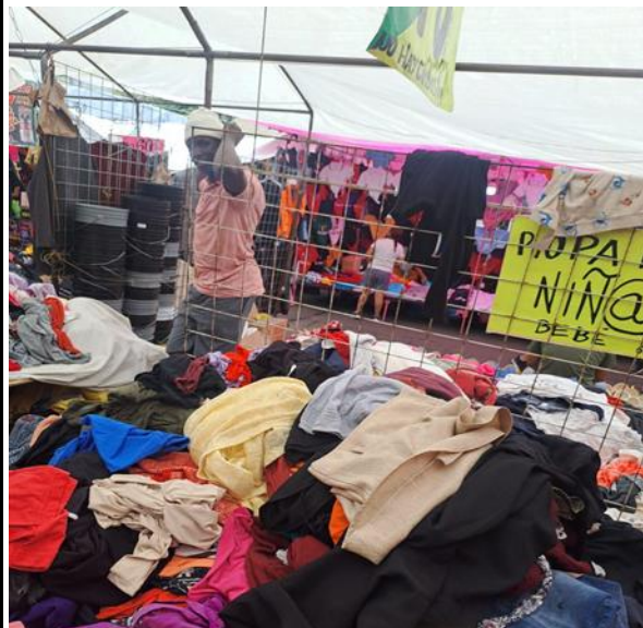
Imagen 4. Puesto de paca en el tianguis

Avenida de las Torres. 1 de septiembre de 2024