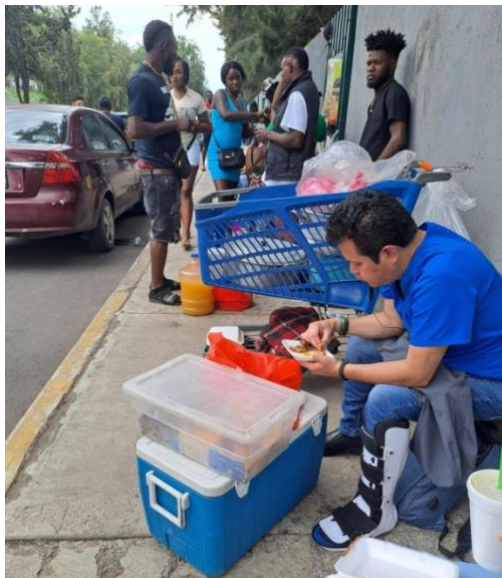
Imagen 3. Puesto de comida tradicional

Calle Heberto Castillo. 21 de agosto 2024