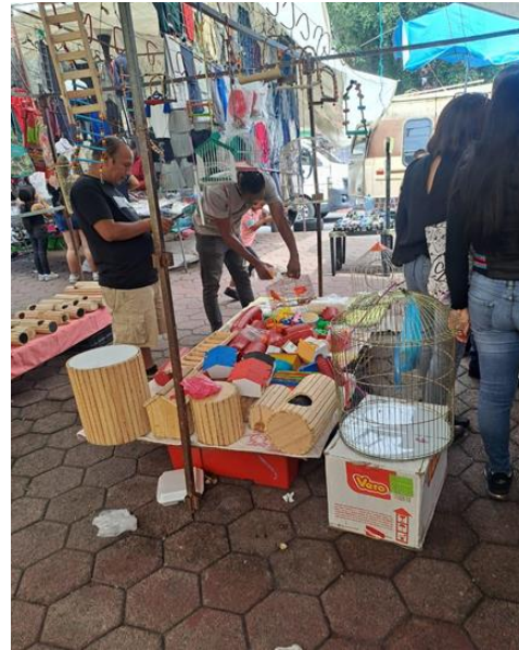
Imagen 6. Migrante alimentando un pájaro

Fuente: Imagen propia. Tomada 1 de agosto del 2024 en la Avenida de las torres