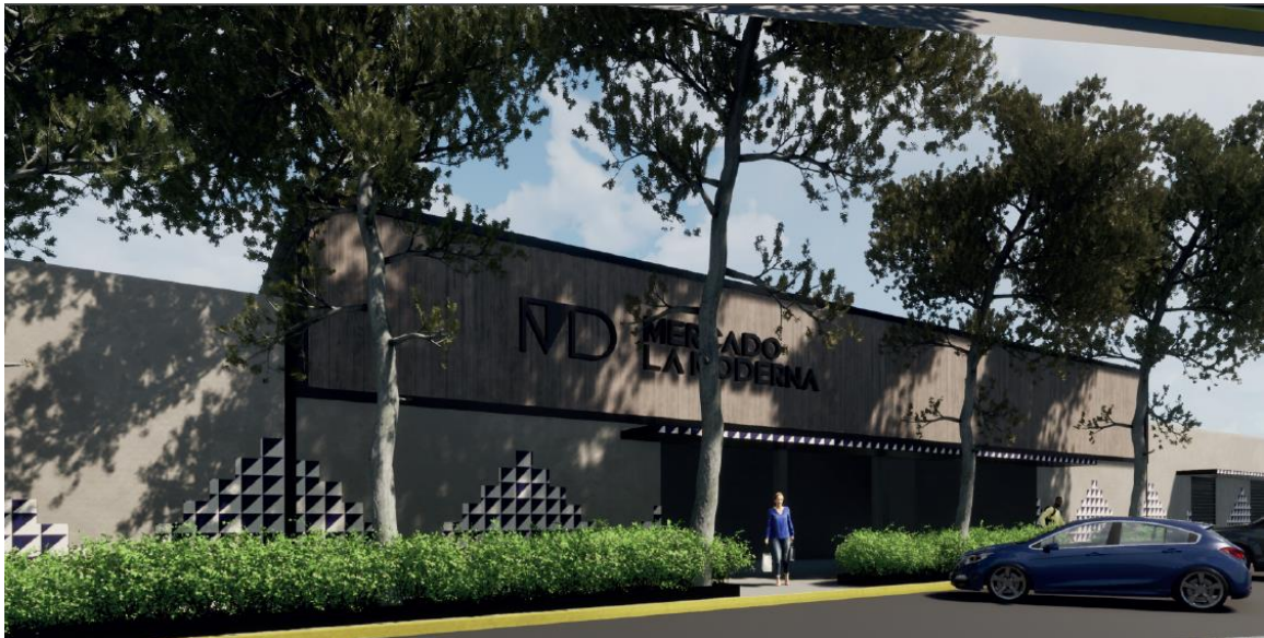
Imagen 2. Propuesta de fachada frontal para Mercado La Moderna