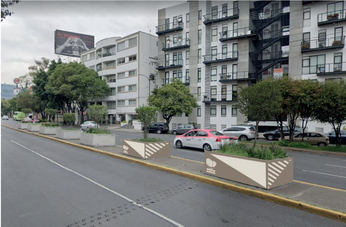
Imagen 5. Fotomontaje de la propuesta de pintura para macetones