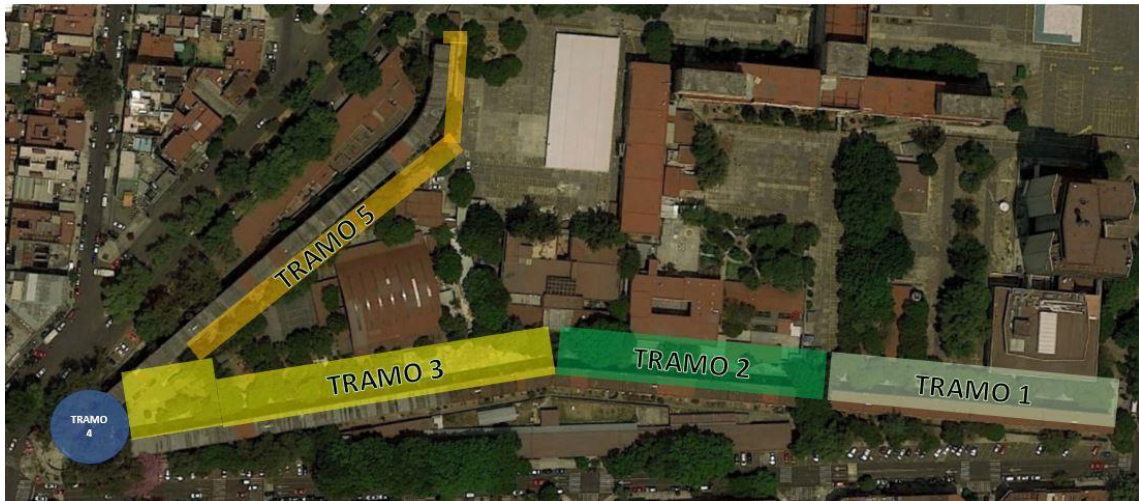
Imagen 7. Repartición de tramos para la realización del levantamiento arquitectónico y fotográfico