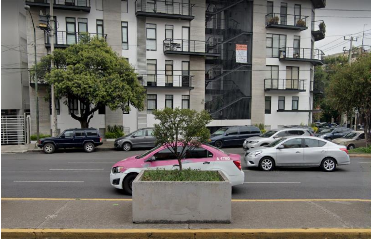
Imagen 3. Levantamiento fotográfico de macetones ubicados sobre Av. Universidad