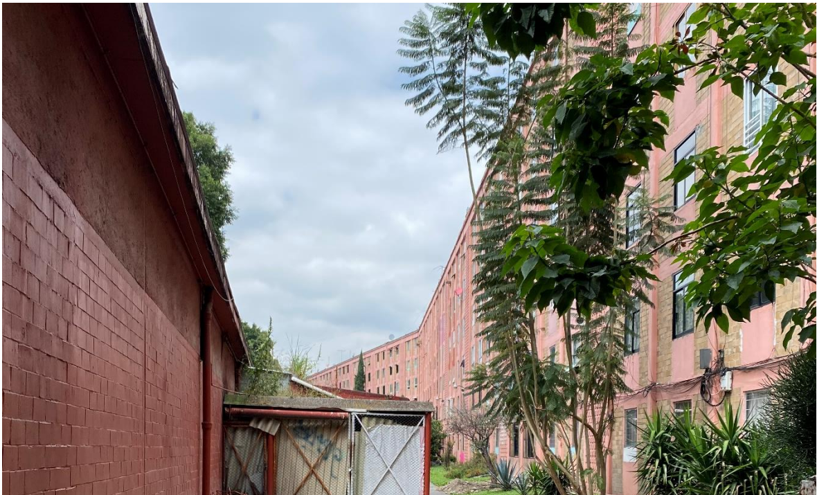
Imagen 6. Unidad Habitacional IMSS Narvarte