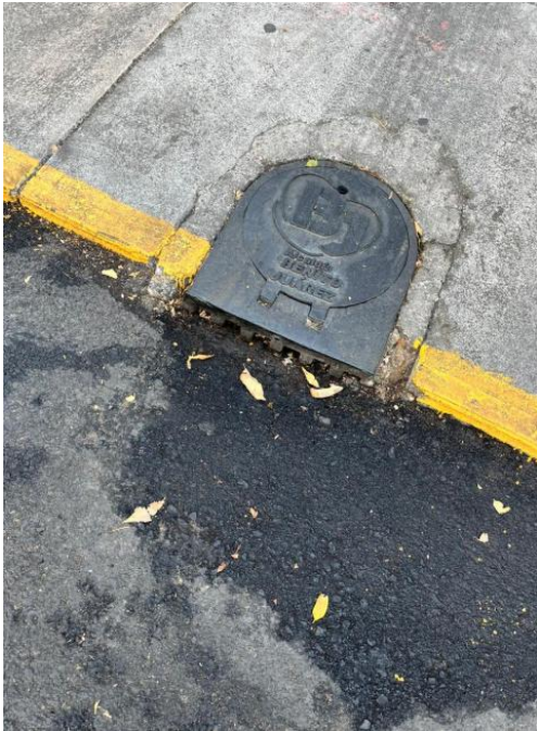
Foto 4. Reporte por invasión de coladera por trabajos de repavimentación.

Se realizó un reporte informando que la repavimentación está obstruyendo la coladera, afectando el desnivel para el agua de lluvia.