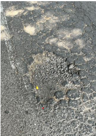
Foto 2. Reporte de bache

Se verifica que el pavimento nuevo no obstruya la pendiente de la coladera, además de tomar las medidas de la alcantarilla para descontar los metros cuadrados de la repavimentación ya que esto se resta del costo de la pavimentación