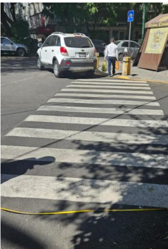
Foto 3. Levantamiento de paso de cebra.

Durante los recorridos se reportaron baches y raíces invadiendo el pavimento, estas situaciones se reportan para avisar a la empresa.