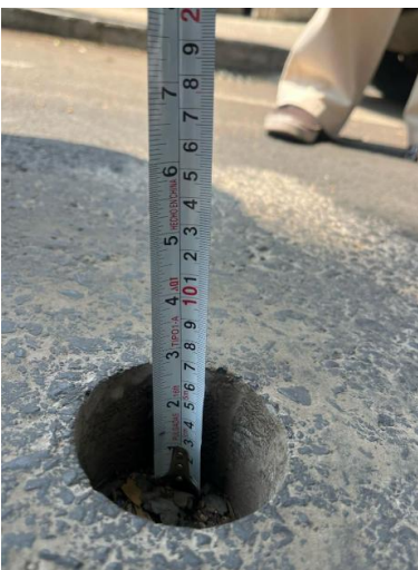
Foto 8. verificación de profundidad para pruebas de resistencia.

Se realiza un recorrido para corroborar que las plantas sí se encuentren. Pero al no cumplir con lo estipulado con el contrato se procede a realizar un reporte a la empresa por el incumplimiento de la siembra.