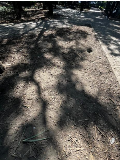
Foto 7. Reporte fotográfico por incumplimiento de siembra de plantas.

Levantamiento del balizamiento en pasos de cebra y topes para verificar que la pintura usada coincidiera con lo estipulado en el contrato.