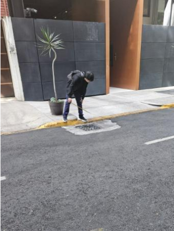
Foto 1. Supervisión de pavimentación.

Se verifica que el pavimento nuevo no obstruya la pendiente de la coladera, además de tomar las medidas de la alcantarilla para descontar los metros cuadrados de la repavimentación ya que esto se resta del costo de la pavimentación