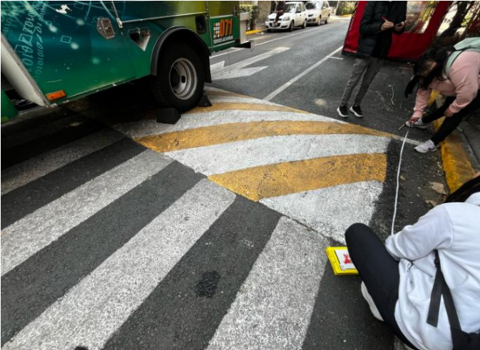
Foto 6. Levantamiento de balizamiento.

Levantamiento del balizamiento en pasos de cebra y topes para verificar que la pintura usada coincidiera con lo estipulado en el contrato.