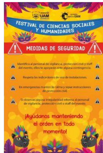
Imagen 20. Flyer Medidas de seguridad "Festival CSH"