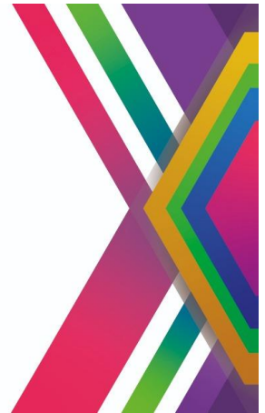
Imagen 31. Diseño para constancia "Festival de CSH" 2