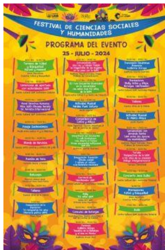
Imagen 19. Flyer Programa "Festival de CSH"