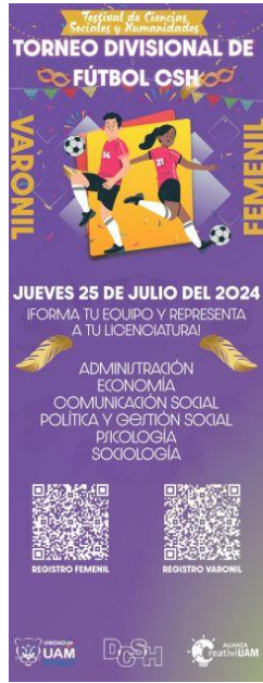
Imagen 22. Banner Torneo Fútbol CSH