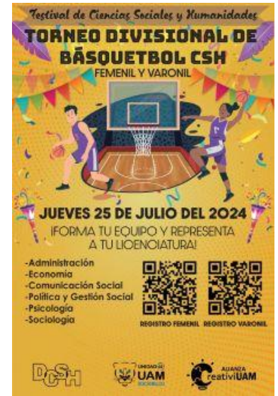
Imagen 6. Flyer Torneo básquetbol CSH