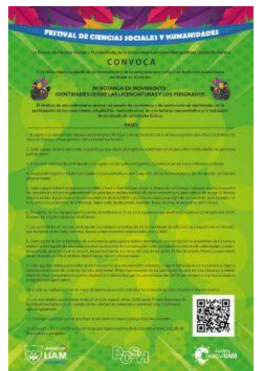
Imagen 10. Flyer Convocatoria "Mi botarga en movimiento"