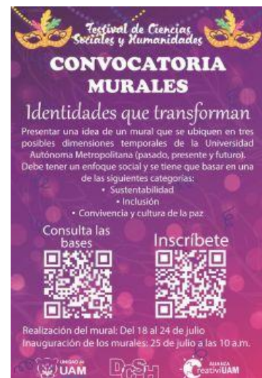
Imagen 11. Flyer Convocatoria "Murales: Identidades que transforman"