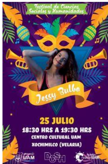
Imagen 17. Flyer Concierto Jessy Bulbo