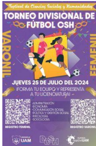
Imagen 5. Flyer Torneo fútbol CSH