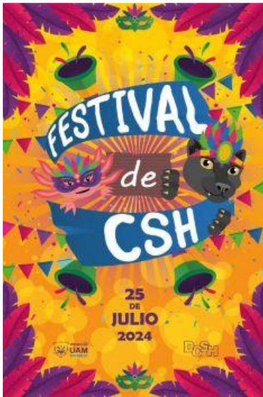
Imagen 4. Poster "Festival de CSH"