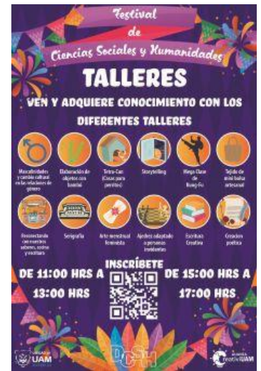
Imagen 18. Flyer Talleres