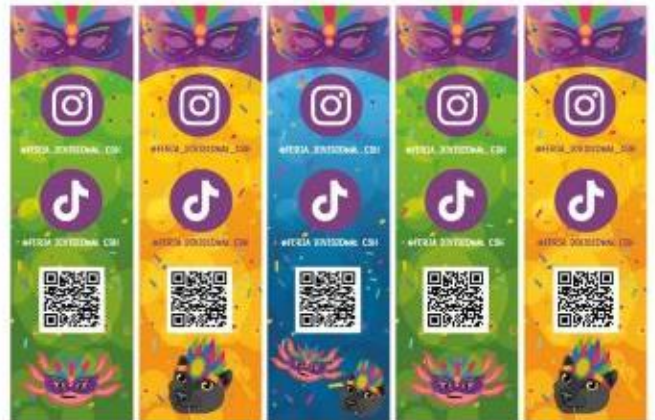
Imagen 28. Diseño de separadores "Festival de CSH" - Vista trasera