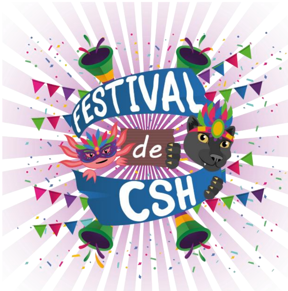
Imagen 3. Logo representativo "Festival de CSH"