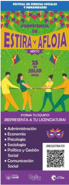
Imagen 21. Banner Competencia Estira y Afloja