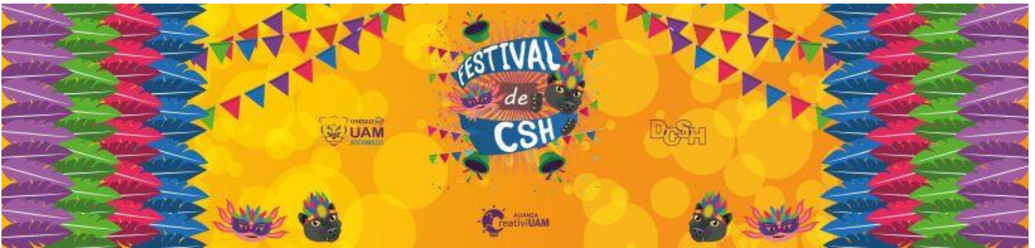
Imagen 26. Diseño de lona publicitaria "Festival CSH"