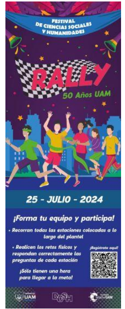
Imagen 25. Banner Rally 50 años UAM