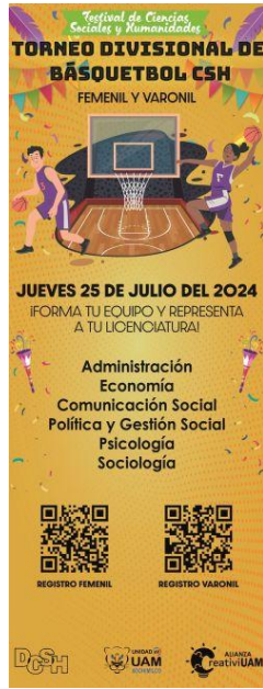
Imagen 23. Banner Torneo Básquetbol CSH