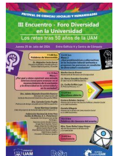
Imagen 12. Flyer "III Encuentro - Foro Diversidad en la Universidad"