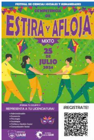
Imagen 7. Flyer Competencia Estira y Afloja