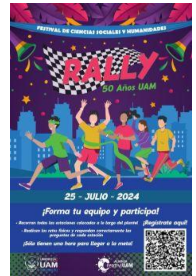
Imagen 9. Flyer Rally 50 años UAM