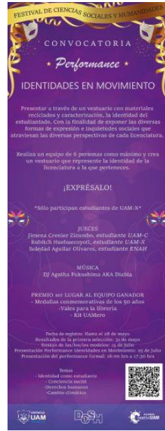
Imagen 24. Banner Performance