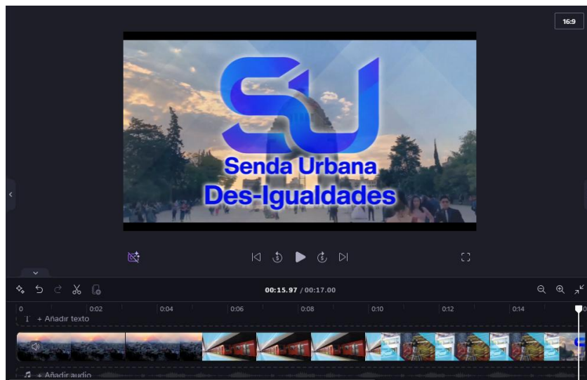
Imagen 32. Edición Cortinilla "Senda Urbana - Des-Igualdades"