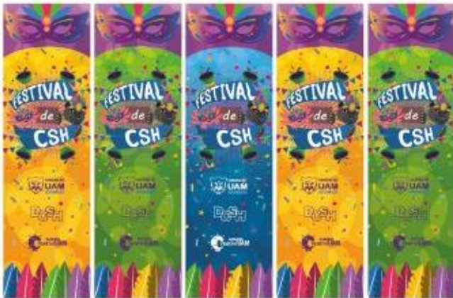
Imagen 27. Diseño de separadores "Festival de CSH" - Vista frontal