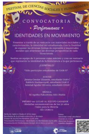
Imagen 8. Flyer Convocatoria "Identidades en Movimiento"