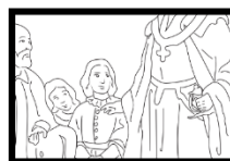
CRISTÓBAL COLÓN EN LA CORTE DE LOS REYES CATÓLICOS, JUAN CORDERO (1822 - 1884)