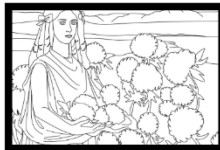
NIÑA CON HORTENSIAS, C.A., 1916. ALFREDO RAMOS MARTINEZ.

VE A LA EXPOSICIÓN DEL SIGLO XX Y DESCUBRE DOS NIÑAS EN LAS PINTURAS.