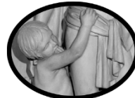
FRAY BARTOLOME DE LAS CASAS CONVIRTIENDO A UNA FAMILIA AZTECA, MIGUEL NOREÑA