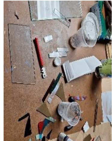
preparación de mosaicos de vidrio

Paralelamente, se realizó la toma de medidas exactas del muro exterior del taller de vidrio, con el fin de comprender las dimensiones reales del espacio disponible y planear el montaje del mural de forma precisa. Esta etapa incluyó el levantamiento de planos del área y el registro detallado de las dimensiones de cada uno de los paneles de vidrio ya producidos.