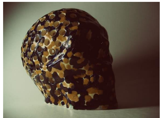
Resultado de piezas decoradas para la ofrenda del edificio de diseño industrial