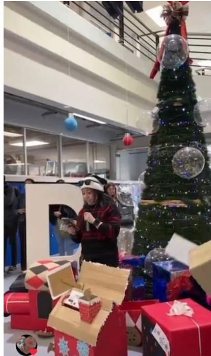
Celebración de navidad en DIX con arbol producido en el fondo

De igual forma, durante la temporada navideña se brindó apoyo en el diseño y fabricación de la estructura del árbol de Navidad, que fue instalado en un espacio central del edificio. Esta actividad no solo buscó decorar, sino también generar un símbolo de unión y cierre de ciclo académico, integrando tanto elementos funcionales como expresivos.