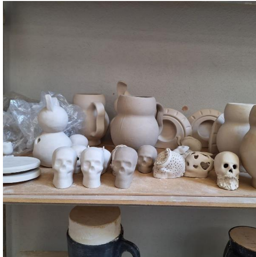
piezas sancochadas para la ofrenda de diseño industrial

Ya con la cerámica lista, se aplicaron fragmentos de vidrio reciclado de distintos colores sobre sus superficies, cuidando tanto la composición estética como la cantidad y distribución del material, para lograr una fusión adecuada durante el horneado final. En la segunda quema, el calor permitió que el vidrio se derritiera parcialmente, integrándose a la cerámica y generando texturas brillantes y efectos visuales únicos, que dieron a cada pieza un valor tanto artístico como simbólico.