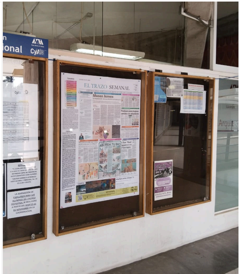
Evidencia de montaje en CyAD 3er Piso