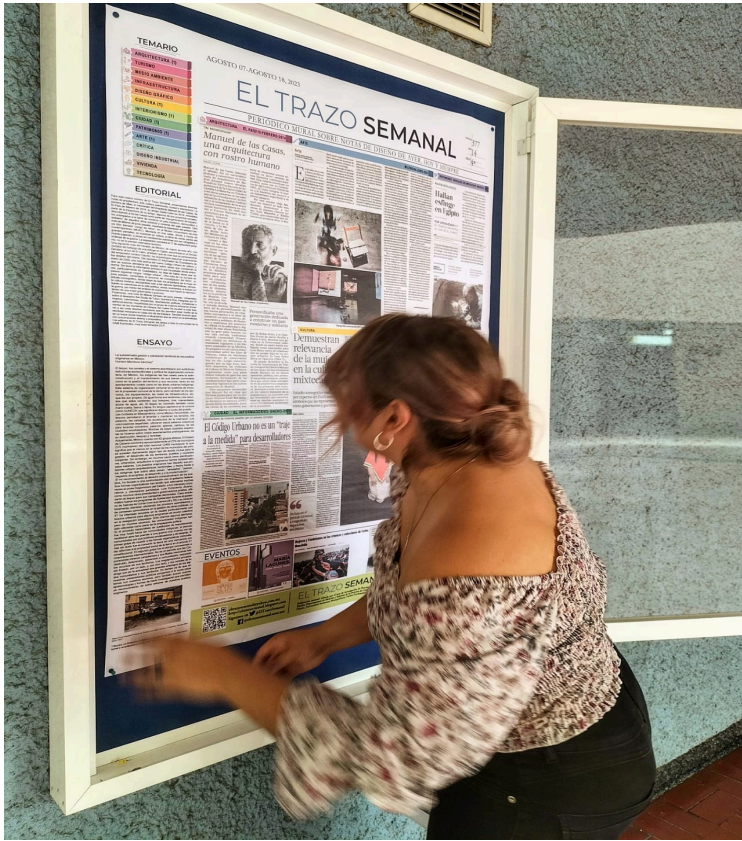
Montaje en Edificio Central