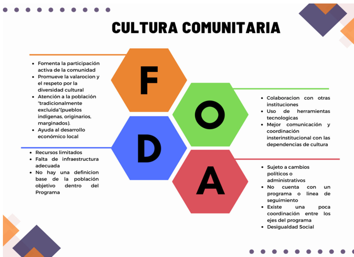
Figura 2 FODA AL PCC