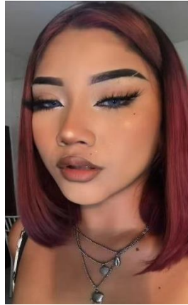
Capturas de pantalla del TikTok 1 de maquillaje.

Los resultados totales de violencia digital de este video se representaron en: