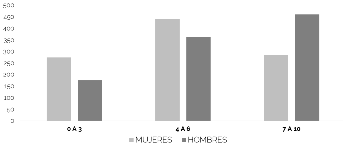
Gráfica 1. Tasa de percepción de seguridad dentro de la alcaldía Tlalpan cada 1,000 habitantes, por sexo