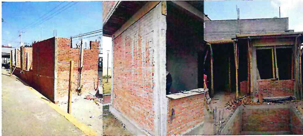
Foto 3, 4, 5, Muros de tabique rojo recocido castillos dalas de cerramiento y losa de concreto armado.