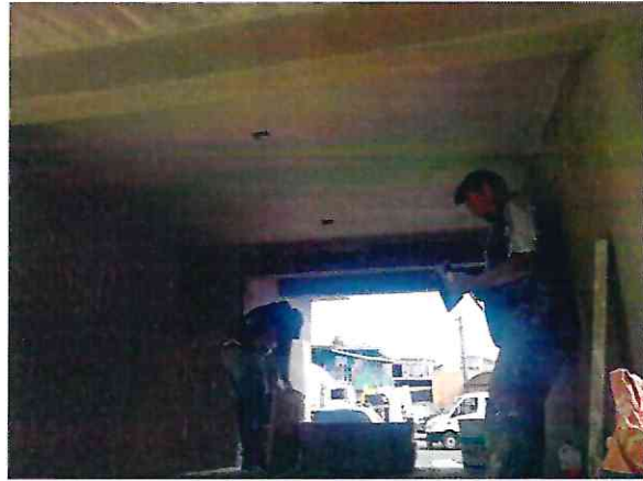
Foto 9, 10 colocación de aplanados en muros y plafones