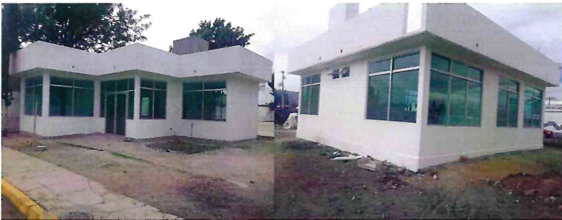
Foto 11, 12 Fachadas y cancelería del centro de desarrollo comunitario