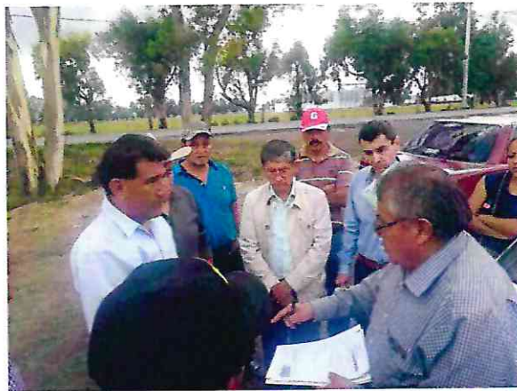
Foto 1. Conformación de COCICOVI

Dentro del órgano interno de control teníamos la tarea de conformar los COCICOVI'S siendo este el Comité Ciudadano de Control y Vigilancia, integrado por vecinos elegidos por la comunidad y cuya función es el vigilar la correcta aplicación de los recursos públicos, federales estatales y/o municipales asignados a obras y programas sociales de los que son usuarios o beneficiarios (ver foto 1)