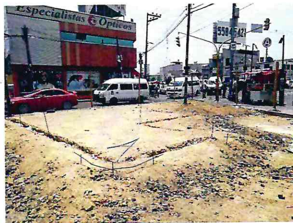
Foto 2. Trazo para desplante de construcción

El trabajo realizado fue la supervisión de la obra principal mente desde el trazo del terreno donde debíamos cuidar los límites de la propiedad, colindancia y su adecuada orientación, interactuando con la empresa constructora responsable de dicho proyecto en conjunto con el COCICOVI ya que ellos fungían con usuarios y beneficiarios de posterior inmueble, por ello en todo momento fue tomado en cuenta.