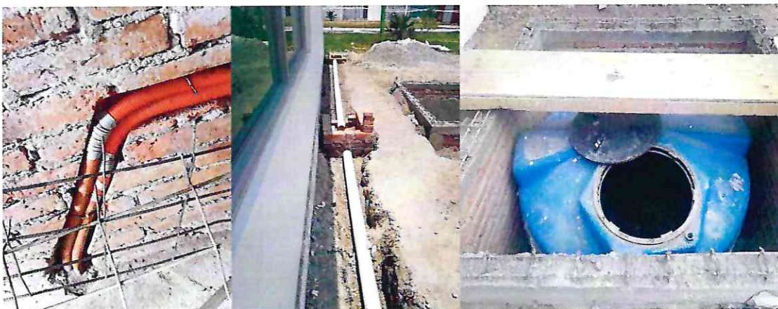
Foto 6, 7, 8, colocación de componentes de instalaciones

Posteriormente el cuidar la adecuada colocación de los componentes de las instalaciones eléctricas y hidrosanitarias en momento indicado y conforme al proceso constructivo, para no afectar posteriores procedimientos y garantizar sus funcionalidad, la instalación eléctrica fue realizado principalmente por muros y plafones con manguera corrugada plolifles o poliducto, chalupas y cajas galvanizadas. La instalación hidráulica consistía en la elaboración de una fosa de muros de tabique rojo recocido, castillos, dalas de cerramiento y losa de concreto armado para alojar el tinaco cisterna y tubería de PVC hidráulico para los servicios de baños y tarjas y la instalación sanitaria se realizado con tubería de PVC en bajadas de agua pluvial y desagüe de aguas negras y fabricación de registros sanitarios de tabique.