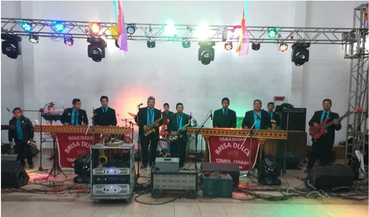
Ilustración 3 Marimba Orquesta Brisa Dulce