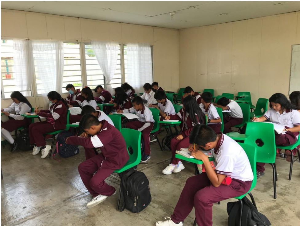
Ilustración 4 Jóvenes de la Escuela secundaria técnica # 107 Tzimol Chiapas