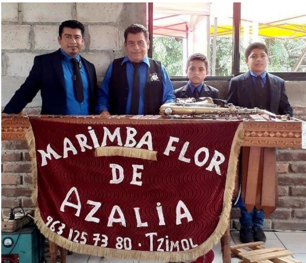
Ilustración 2 Marimba Orquesta Flor de Azalea