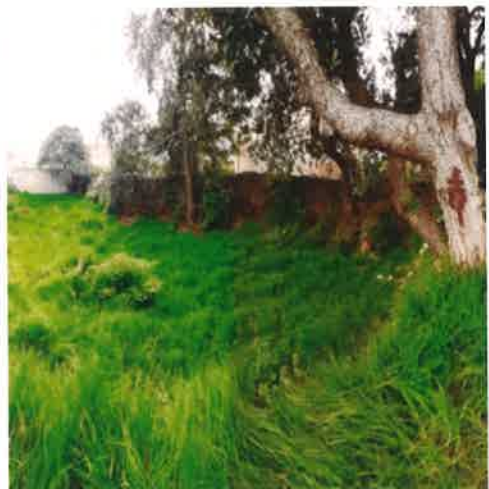
Terreno de trabajo