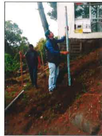
Trabajos de rehabilitación del Huerto