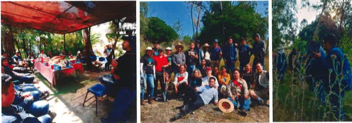
Equipo de trabajo para la reforestación

Las técnicas son efectuadas con el conocimiento tomado mediante cursos y retroalimentación, teniendo la idea clara de no romper con la biodiversidad existente del área. Fue placentero e interesante poder ser parte de esta actividad, unificando relaciones sociales de nuevo conocimiento en este proceso.