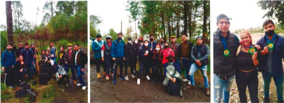
Equipo de trabajo para la reforestación

Se reforestó sembrando vegetación nativa del sitio, para equilibrar la tala ilegal de árboles en la misma zona, esta actividad participativa me generó cuestionamientos sobre la destrucción masiva de la vegetación. Esta actividad fue una de las maneras en la que pude ayudar poco o mucho en la reforestación en conjunto a mis compañeros del Servicio y los pobladores que nos brindaron herramientas y equipo necesario para este trabajo.