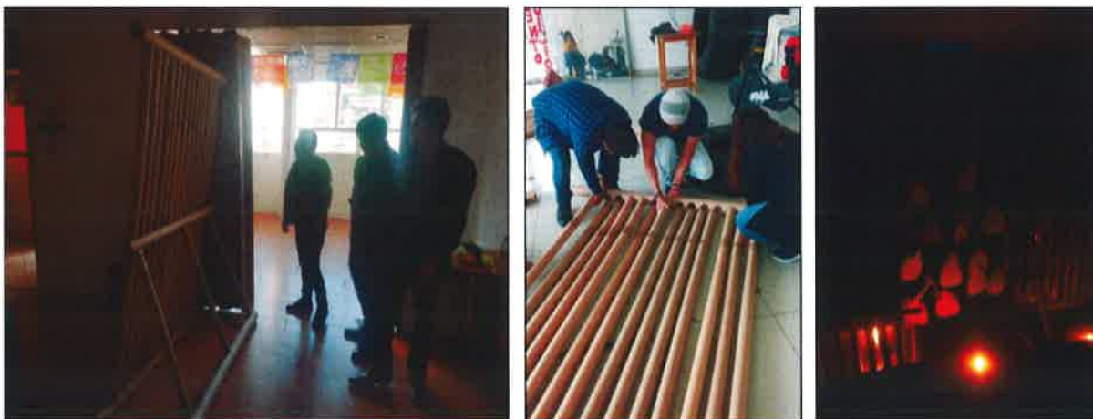
Trabajo de las mamparas con tubos de cartón

Se propuso modular el Salón de usos múltiples para generar un recorrido, reutilizamos materiales proporcionados por el área de producción que fueron tubos de cartón con los cuales pudimos hacer mamparas que nos ayudaron a seccionar el espacio y donde se pudieran colocar las escenografías de las leyendas. En este ejercicio pude aplicar mi creatividad y desarrollar distintas habilidades.