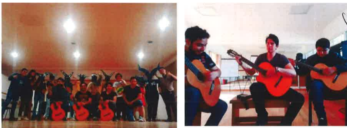
Ensayos del ensamble de guitarra

Esta actividad fue ejecutada en conjunto a la representación de Danza Folklórica organizado por los mismo compañeros, donde se representaron las tradiciones culturales en baile y música