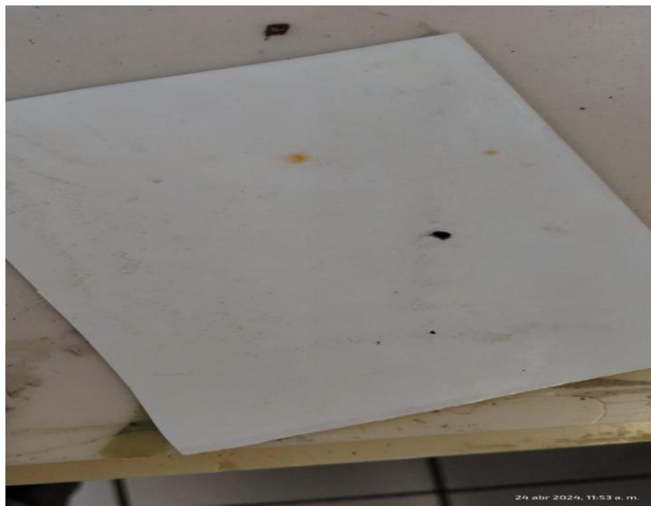
Figura 6. Prueba de Walker positiva reflejada en papel fotografía especial.

Esta prueba se utilizó para determinar el ángulo de impacto de una bala, ayudando a recrear la escena del crimen. Esto fue posible gracias a la tinción de color naranja en forma de puntos que se observó en los papeles fotográficos especiales, como se muestra en la Figura 6. Estos resultados permitieron al cuerpo forense establecer la entrada y salida del disparo.