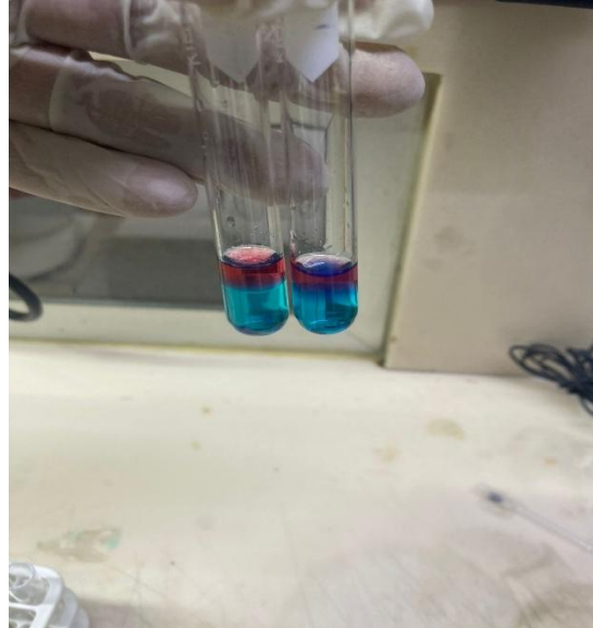
Figura 4. Prueba de Scott hecha en laboratorio como prueba preliminar para identificar cocaína

hacerla en el laboratorio. La característica de esta prueba es que, en presencia de cocaína, la sustancia se tiñó de color azul, mostrando una división de azul con rosa, como se observa en la Figura 4.