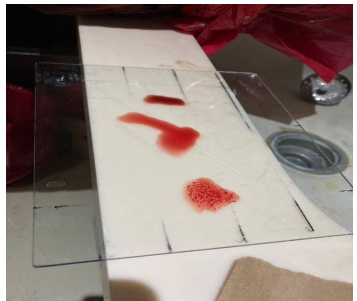
Figura 2. Prueba para tipo de sangre aglutinación en donde se colocó antisuero Rh