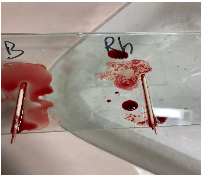
Figura 1. Prueba para tipo de sangre aglutinación en donde se colocó antisuero Rh

Esta prueba se realizó para identificar el grupo sanguíneo de la persona juzgada o víctima de un hecho delictivo, de modo que la determinación pudiera ser presentada como evidencia que apoyara la investigación. Cuando se presentó aglutinación con alguno de los antisueros, se indicó el tipo sanguíneo de la muestra. Como se observó en las Figuras 1 y 2, la aglutinación ocurrió en las zonas donde se aplicó el antisuero de tipo Rh, confirmando la presencia del factor Rh en la muestra.