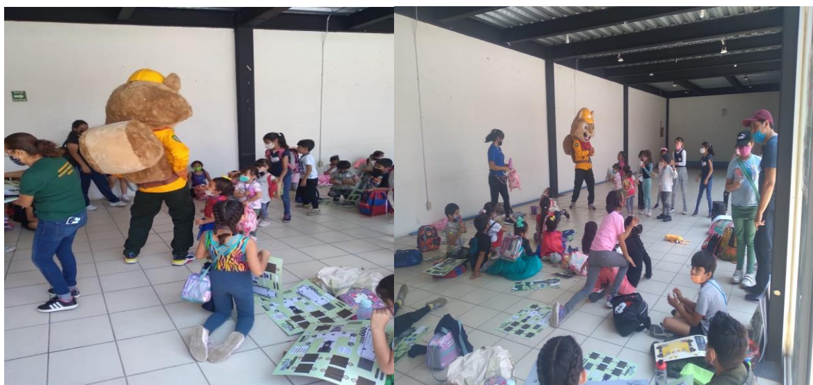
Imagen 16 y 17. Fotografías tomadas durante la participación de las actividades de Cultura Forestal en cursos de verano.