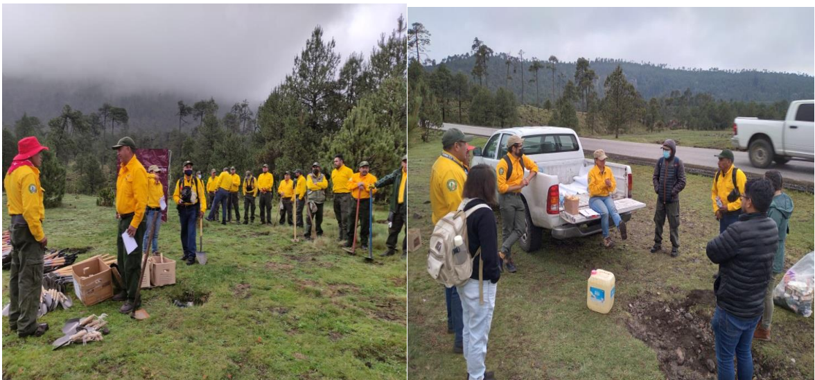
Imagen 19 y 20. Fotografías tomadas durante la participación de la Jornada Social de Cultivo a la Reforestación en los Bienes Comunes de San Miguel Ajusco, Tlalpan 2022.