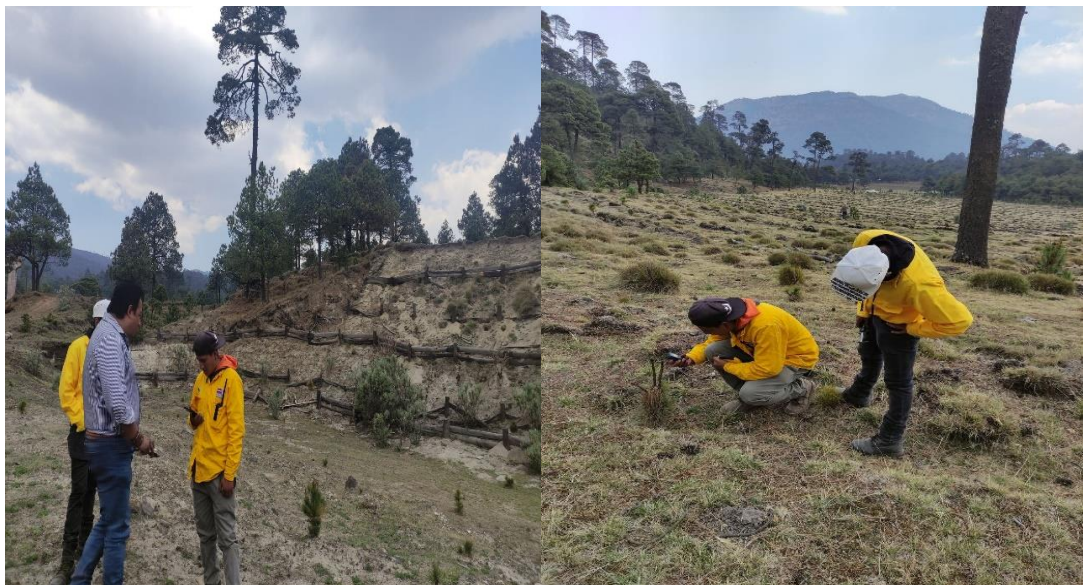
Imagen 8 y 9. Fotografías tomadas durante el recorrido del 20 de mayo al ejido Magdalena Petlacalco