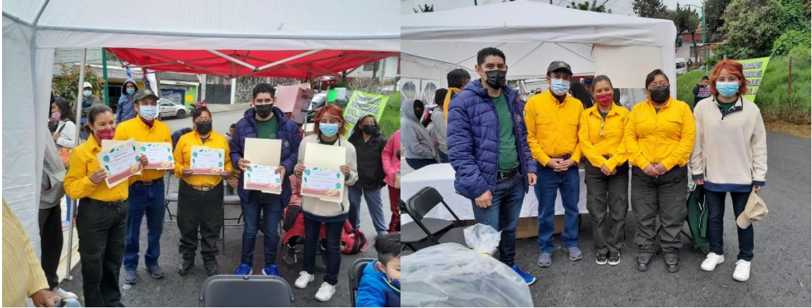
Imagen 17 y 18. Fotografías tomadas durante la participación de las actividades de Cultura Forestal en la Magdalena Contreras.