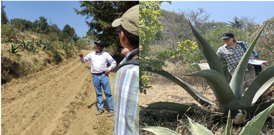
Imagen 6 y 7. Fotografías tomadas durante el recorrido del 7 de abril al ejido San Miguel Xicalco.