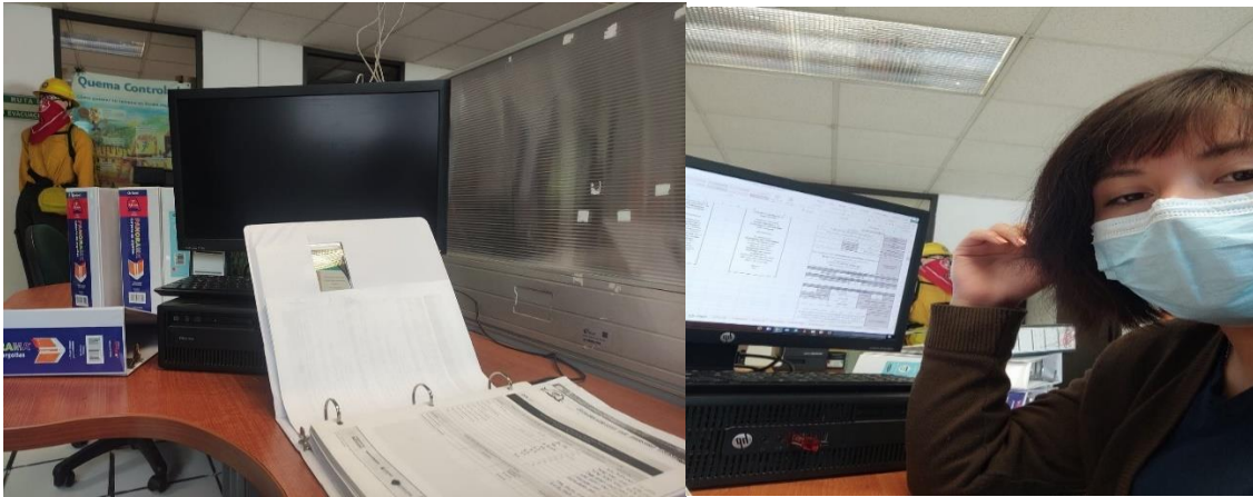
Imagen 1 y 2. Fotografías tomadas durante la realización de las actividades administrativas en el espacio dado para trabajo.