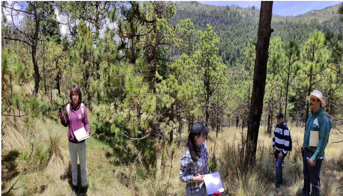
Imagen 10 y 11. Fotografías tomadas durante el recorrido del 13 de mayo a Acopilco Cuajimalpa de Morelos.