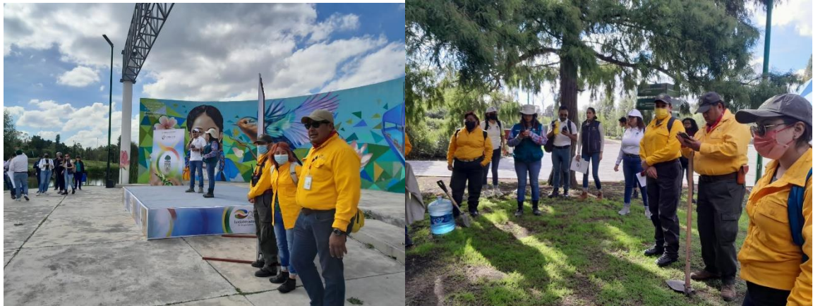
Imagen 21 y 22. Fotografías tomadas durante la participación de la jornada de Reforestación Social “Un Nuevo Bosque 2022” Xochimilco.