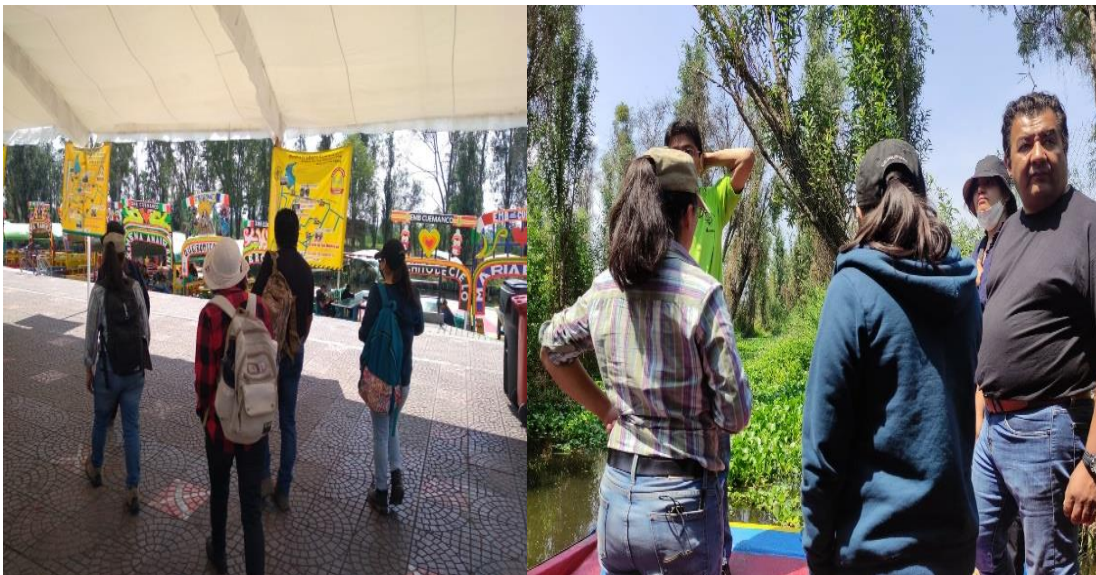
Imagen 12 y 13. Fotografías tomadas durante el recorrido del 30 de mayo a Xochimilco.