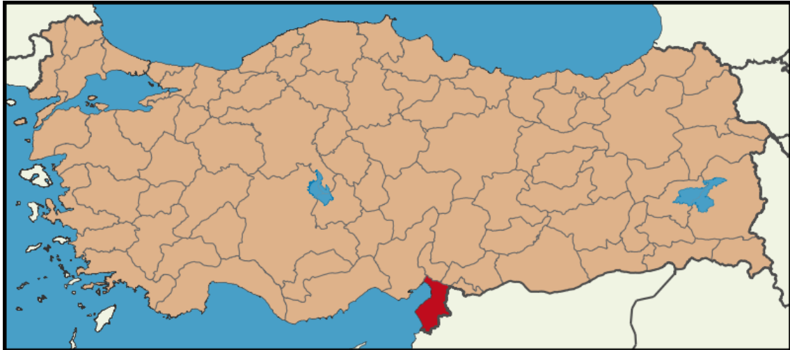
MAPA 3: Localización de la región de Hatay y su anexión a Turquía.

aseguraran la pertenencia de Turquía al bloque occidental o cuando menos permanecer neutral. (Mapa 3)