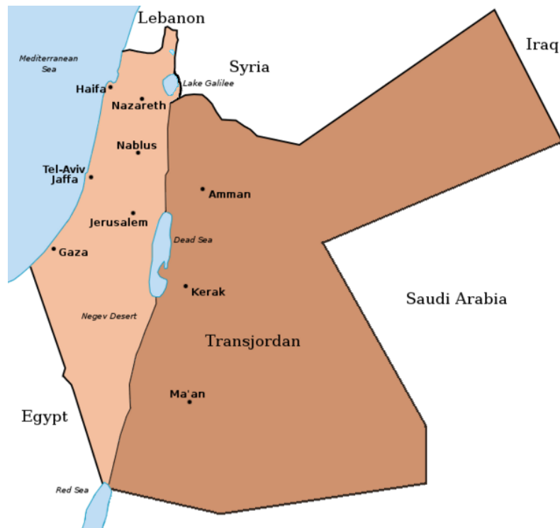
Mapa 6: Territorio palestino bajo el mandato de Inglaterra

enfrentar las crecientes tensiones con los judíos. La decisión de Inglaterra de solicitar el fin del mandato en territorio palestino estuvo impulsada por el ataque de las organizaciones armadas sionistas a los británicos en 1946 como represalia por no aumentar el número permitido de refugiados judíos.