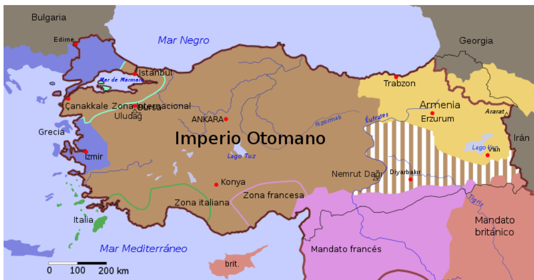
MAPA 2.- Consolidación de Turquía a través del Tratado de Lausana de 1923

Después de terminar con la influencia de las potencias extranjeras en territorio otomano, el Partido Republicano del Pueblo (CHP) 10 fundado por Mustafá Kemal obtuvo el triunfo en elecciones proclamando el nacimiento de la República de Turquía el 29 de octubre de 1923, Kemal enarbolaba la esencia de un Estado moderno que fusionara los valores otomanos y la modernidad de occidente. (Mapa 2).