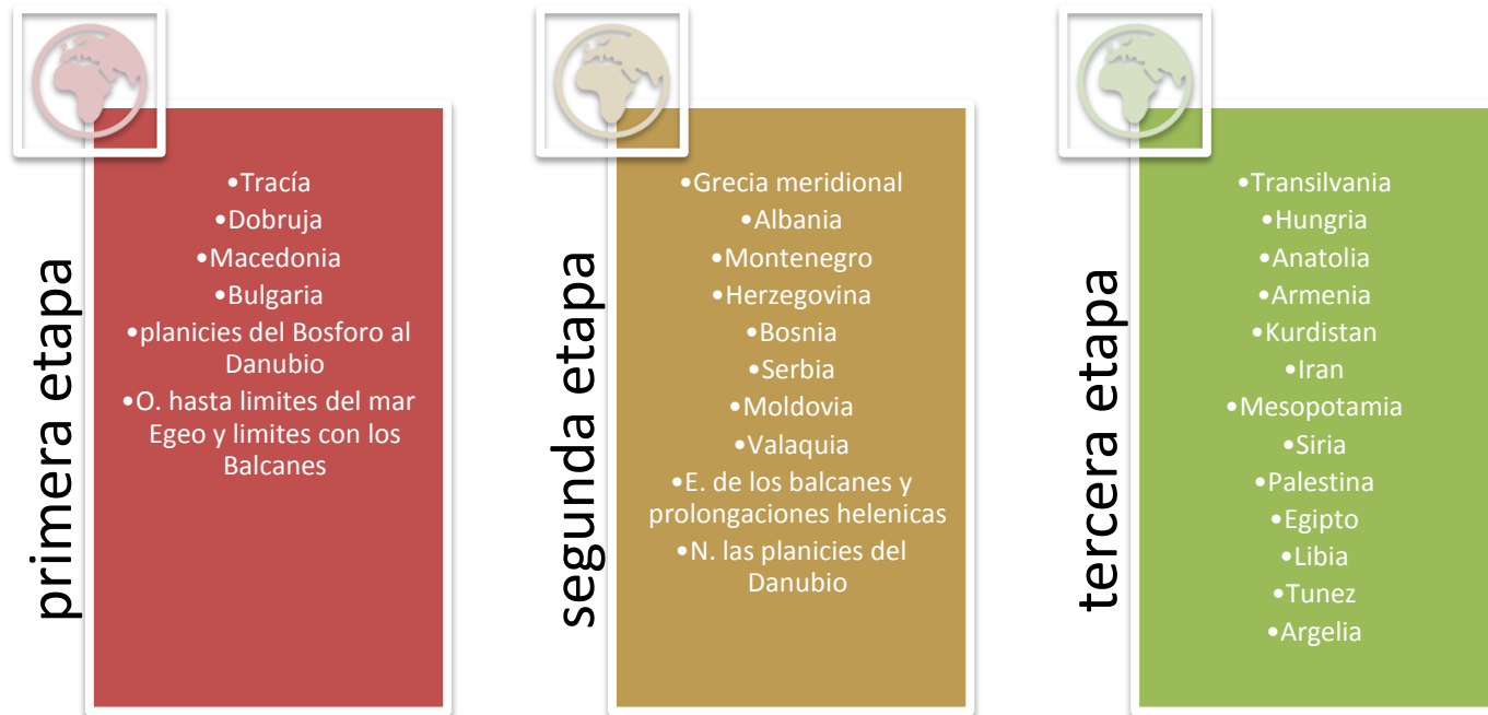
DIAGRAMA 1: Expansión territorial del Imperio Otomano