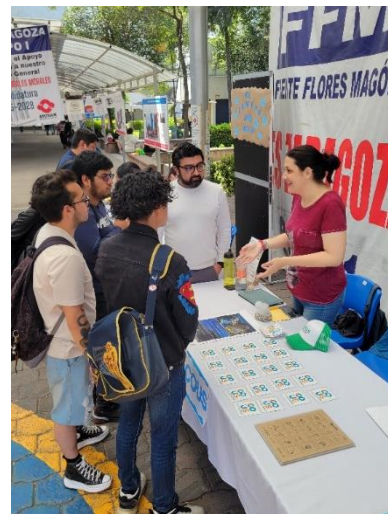
Fig. 4. Stand COUS en FES Zaragoza. Fotografías por Juan Alvarado, 2025.