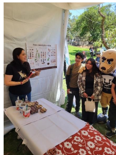
Fig. 6. Stand COUS en la ENCIT.

Además de las actividades antes mencionadas, también se tuvo participación con un taller de concientización relacionado con el agua y la importancia de los glaciares en el país y el mundo debido a que, en muchos casos este tema pasa por desapercibido y