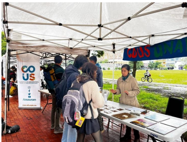
Fig. 5. Stand COUS en las Islas, CU.

Para la plática de introducción de este taller, la coordinación me permitió vincular el tema con la licenciatura para dar un ejemplo del uso e importancia del maíz en la práctica del diseño industrial. Decidí traer a la mesa la impresión 3D porque ha sido una de las formas de materialización de diversos modelos u objetos de diseño, ya que presenta una gran versatilidad y ajuste en piezas que requieren ángulos en específico o detalles que, por otros procesos, no son tan fáciles de obtener. Pero, ese no era el tema principal, me di a la tarea de tener un fuerte enfoque en el PLA como material de impresión debido a su origen derivado del almidón de maíz y que, tras una serie de procesos puede obtener muy buenas características para imprimir, tener cierta variedad de colores y que después de su uso se puede biodegradar. Con este enfoque, generé una mayor cantidad de opiniones e intereses por parte de las y los espectadores que están en proceso de selección de una carrera, pero, aunque no fuera el caso, siempre se buscó dejar una pizca para crear conciencia y que la sustentabilidad estuviera presente en sus actividades cotidianas.