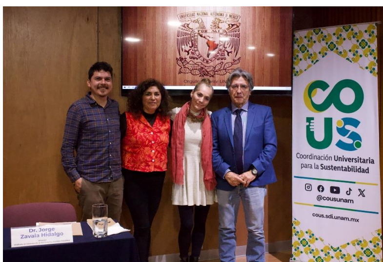
Fig. 8. Participantes de la mesa redonda y Roll Up de la COUS. Fotografías por Juan Alvarado, 2025.

En la parte del anexo, se encontrarán algunas de las infografías y carteles hechos para su divulgación en las redes sociales de la COUS.