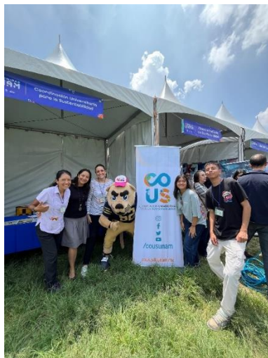
Fig. 3. Stand COUS en Islas, CU. Fotografías por Elizabeth Vargas, 2024.

Después de aprender nueva información con los cursos, comenzaron las actividades como tallerista en las ferias donde la dinámica consistía en hablar del quehacer de la COUS; dar a conocer los cursos en línea que se tienen, buscar generar el interés de las y los jóvenes para que participen dentro de la coordinación como prestadores de servicio social, y también se pudieron crear algunos convenios con maestros y coordinadores de diversas unidades académicas para poder asistir a dar talleres, con el fin de que se logren vincular las licenciaturas impartidas con temas enfocados a la sustentabilidad.