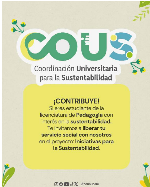
Fig. 8. Invitación a Lic. en Pedagogía. Fotografías por Juan Alvarado, 2025.