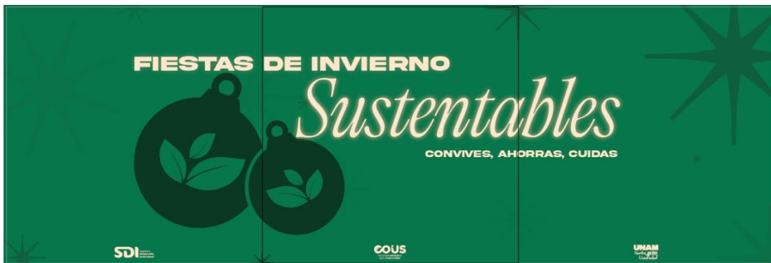
Fig. 7. Carrusel para Instagram.

Otra parte del servicio social consistió en el desarrollo de material visual para las redes sociales de la COUS; infografías, banners, correcciones de color, tablas, entre otras cosas. La coordinación cuenta con una imagen gráfica bastante consolidada y es ahí donde se tuvieron que mezclar elementos como ritmo, formas, relaciones de posición, simetrías y jugar con los elementos que se tenían para poder generar un buen impacto en las personas que siguen las redes sociales de la COUS. De igual forma, se realizaban pequeñas investigaciones para saber con qué elementos se podría trabajar debido a que gran parte de los temas los había escuchado e interpretado desde el enfoque del diseño industrial, también existían temas que desconocía completamente y era ahí donde se requería más atención al detalle.