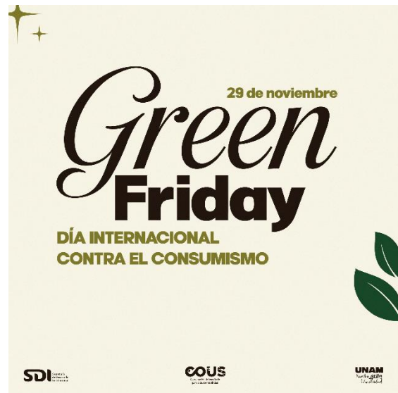
Fig. 11. Infografía. Fotografías por Juan Alvarado, 2024.