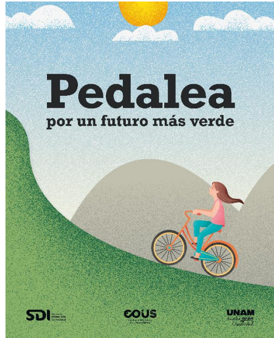
Fig. 9. Cartel para BiciEscuela.