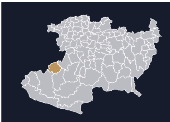
Mapa 4. Municipio de Tepalcatepec Michoacán. (secretaría de Economía)

Tepalcatepec, es un municipio del estado de Michoacán, así como Aguililla, Apatzingán de la constitución y Buenavista, este es un municipio que pertenece a la zona de tierra caliente. Según datos del INEGI, hasta el 2020 Tepalcatepec cuenta con una población de 24, 074 personas, de las cuales 49.9% son del género masculino, mientras que el 50.1% son del género femenino, otro dato a destacar es que en comparación al 2010, la población de Tepalcatepec creció en un 4.73%. (INEGI, 2020)