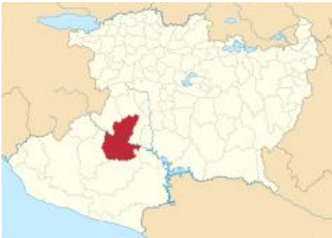
Mapa 2. Municipio de Apatzingán de la constitución, Michoacán.

Apatzingán de la constitución, es un municipio del estado de Michoacán que, así como Buenavista, es uno de los 113 municipios con los que cuenta este estado. Dentro de Apatzingán habitan 126,191 personas (2020) de los cuales el 50.7% son mujeres y el 49.3% son hombres y comparándolo al año 2010, la población de Apatzingán creció un 2.06%. (INEGI, 2020)