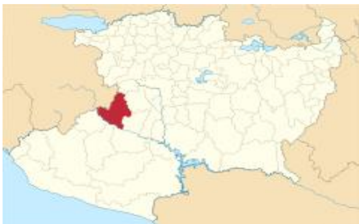
Mapa 1. Municipio de Buenavista, Michoacán. (Wikipedia)

normalmente siempre hace bastante calor. De acuerdo con datos presentados por el INEGI, la población total de este municipio es de 45 538 habitantes, donde el 50.5% son hombres. Un tema para destacar es que este municipio de Buenavista, que tiene como cabecera municipal a Buenavista de Tomatlán, colinda con los otros tres municipios que están dentro de esta investigación, al sureste Apatzingán, al sur Aguililla, y al suroeste Tepalcatepec. (INEGI, 2020)