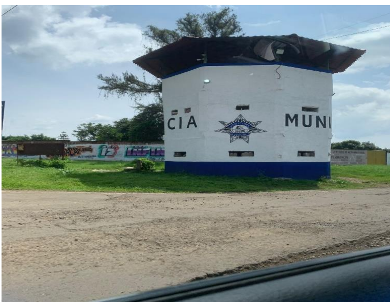
Caseta de policía municipal, era barricada del crimen organizado, Imagen propia.

A partir de 2014 se podía observar en las carreteras del valle de Apatzingán, una sucesión de barricadas puestas en puntos estratégicos funcionando como retenes, donde los autodefensas eran el primer cinturón de seguridad para llegar a los distintos pueblos y rancherías dentro del valle, donde tenían armamento variado, desde viejas escopetas hasta rifles modernos, las personas locales, tenían pasamontañas, chalecos antibalas y ropa militar, donde la idea principal era revisar a los vehículos y conductores, las veinticuatro horas del día. (Le Cour, 2021)