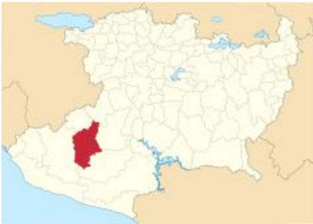
Mapa 3. Municipio de Aguililla, Michoacán. (Wikipedia)

Aguililla Michoacán es un municipio del estado de Michoacán, que pertenece a la denominada zona de tierra caliente en la región del Valle de Apatzingán, cuenta con una población de 14, 754 personas de las cuales 49.7% son hombres y 50.3% son mujeres. Un dato muy interesante y que, sin duda, tiene un trasfondo de seguridad es que, en comparación con el 2010, la población de aguililla disminuyo en un 9%.