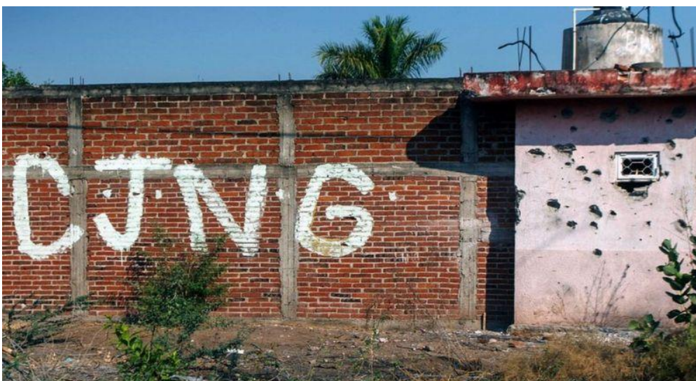
Aguililla, Bastión del CJNG.