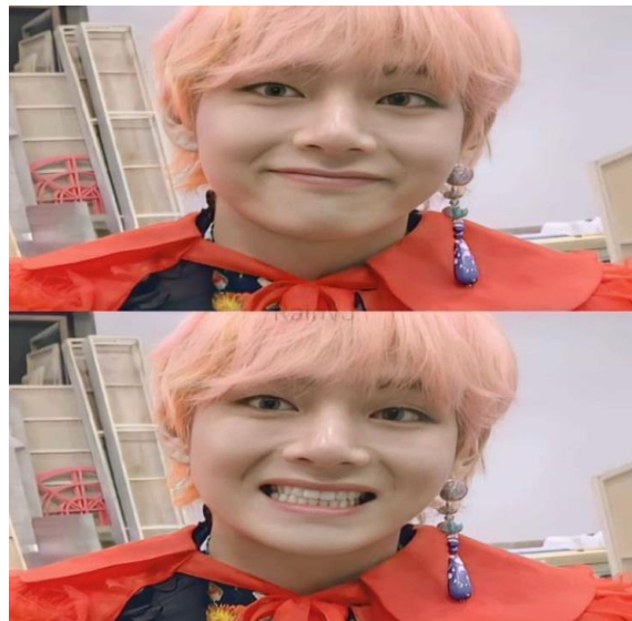
Imagen 4 7