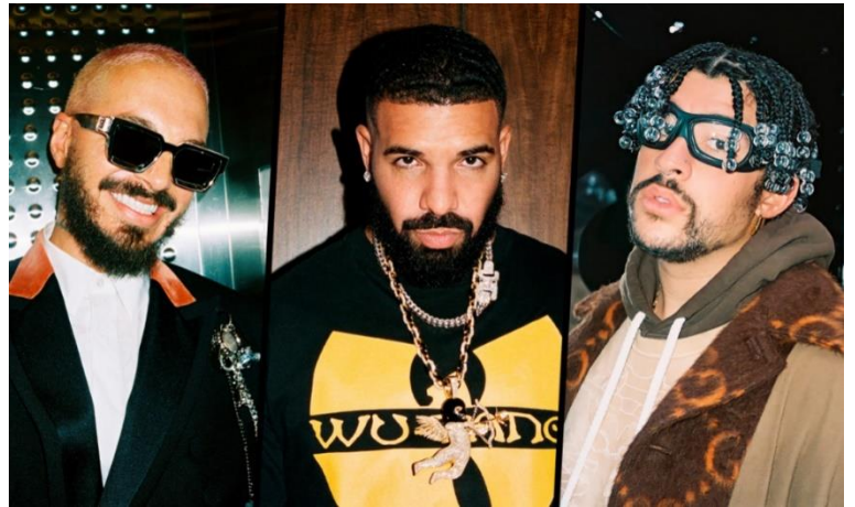
Imagen 6 9