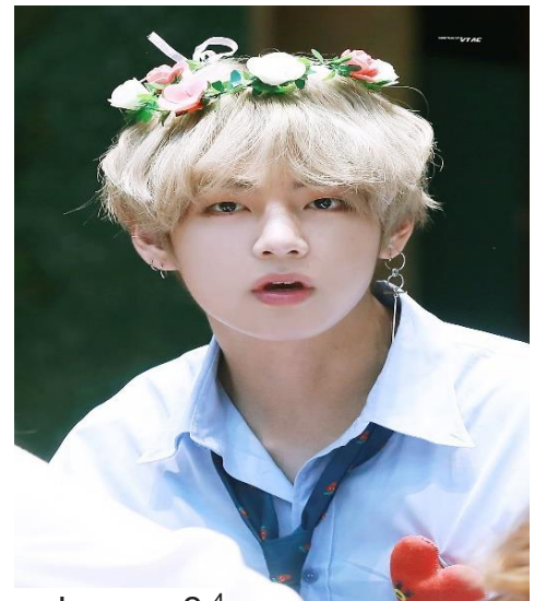
Imagen 2 4