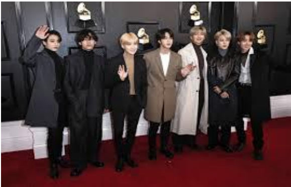
Imagen 5 8