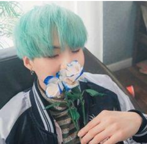
Imagen 3 6

Por un lado, la masculinidad suave se refiere no precisamente a hombres homosexuales, pero estos muestran una masculinidad que no es hipermasculina, sus cuerpos son delgados, delicados, usan maquillaje, se tiñen el cabello de colores pastel y usan ropa un tanto femenina.