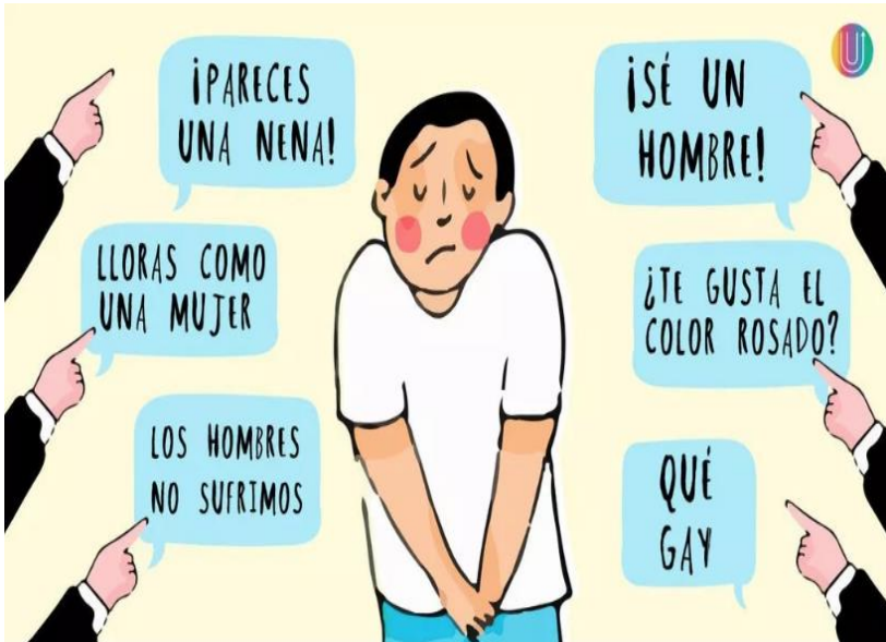
Imagen 1 3