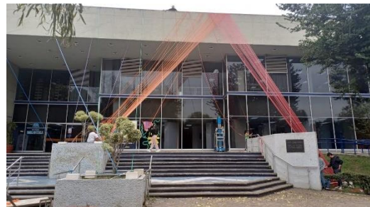
Fotografía 4: Instalación de listones en Biblioteca (Amaya, 2024)

El arte que se creó conectó principalmente a estudiantes de diversas carreras de CYAD de diferentes trimestres, así como egresados, y académicos que trabajaron arduamente para llevar a cabo todo lo planeado, pues, se presentaron algunas complicaciones al momento de su ejecución, pero siempre se mantuvo la resolución de problemas con rapidez y eficacia.