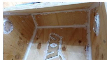
Fotografía 2: Refuerzo interior de silicón blanco (Amaya, 2024)

Dentro de algunas de las múltiples actividades que se llevaron a cabo para poder llevar a la realidad este proyecto, fueron el armado de moldes, los cuales fueron usados como bases para la instalación. El proceso de colado de estos mismos, se basó en una mezcla de cemento, arena, agua y grava, además de la colocación de acelerante, fibra de vidrio y aceite desmoldante. Estos moldes fueron reforzados con silicón blanco para evitar derrames o infiltraciones.