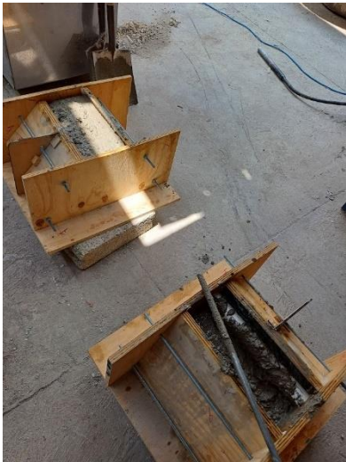
Fotografía 1: Colado de moldes de concreto