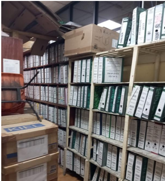
Imagen 07. Archivo técnico.