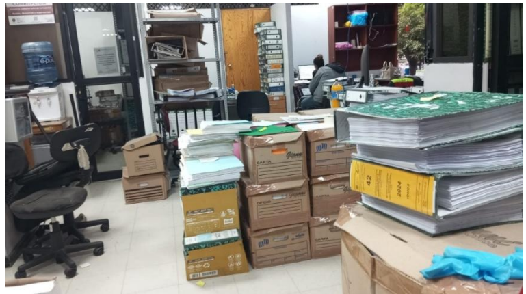
Imagen 08. Archivo histórico.