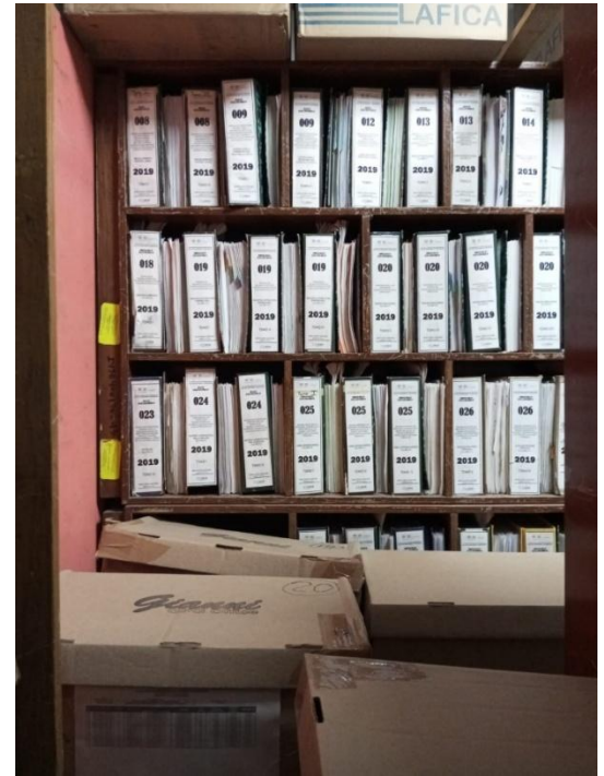
Imagen 06. Archivo técnico.