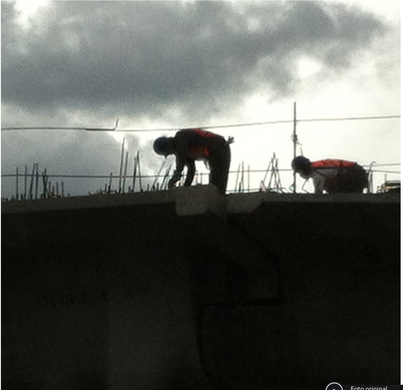
1 Foto original

caso de reflexión la manera tan artesanal como se construyen las grandes vías de esta gran megalopolis en la que habitamos. Y entonces me imaginé que sería posible intervenir dichas imágenes creandoles una especie de poetica alrededor, un pequeño homenaje a los trabajadores que desde su microuniverso llevan a cabo grandes obras.