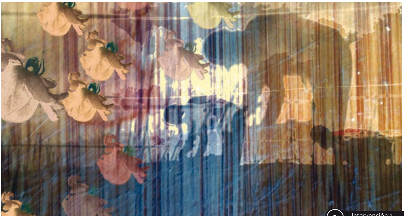
3 Intervención 2

De las primeras pruebas, Megalopolis 2 mini.