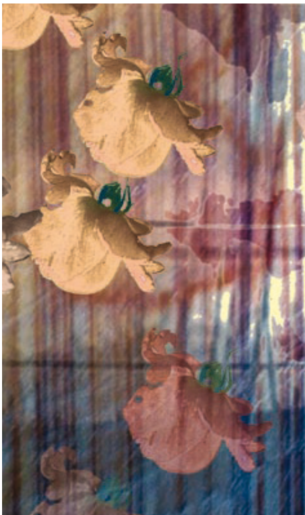
Aplicaciones, Megalopolis 1c mini.