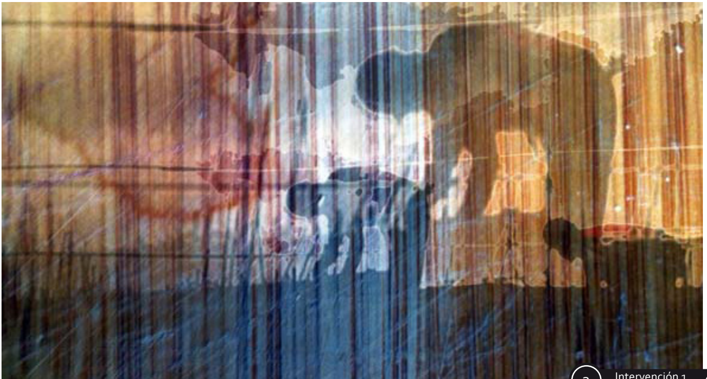
2 Intervención 1

Se llevaron varias pruebas pero las imágenes definitivas para la Exposición, fueron las siguientes: